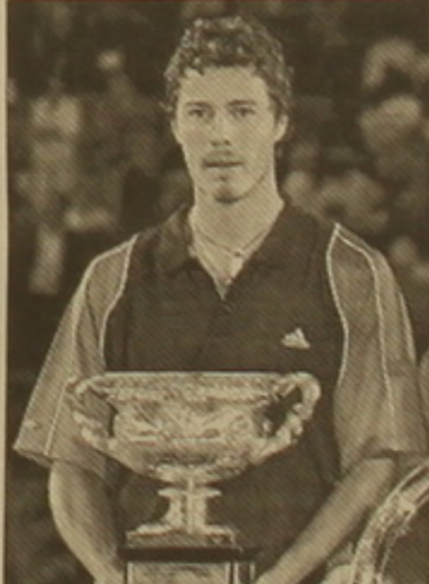
Մարտ Սաֆինը մրցանակով:

Տղամարդկանց մենախաղում գլխավոր մրցանակի համար կորս էին դուրս եկել Մարտ Սաֆինն ու Լեյթոն Հյուիթը: Սաֆինը 3-րդ անգամ էր հանդես գալիս Ավստրալիայի բաց առաջնության եզրափակիչում: Մրցանակը նվաճելու նրա նախորդ երկու փորձերն արդարյուն էին անցել: 2002 թ. նա վճռորոշ խաղում զիջել էր Էվելին Թոմաս Զոնհանսոնին, իսկ անցյալ տարի դարձավ էր Էվելինգարաի Ռոզեր Զեդենբերգին: Եվ ահա երրորդ փորձը յսակվեց հաջողությունը: 2 ժամ 45 րոպե տևած մրցախաղում Սաֆինը լատիսիան մասնեց ավստրալացի Լեյթոն Հյուիթին (1-6, 6-3, 6-4, 6-4): «Մեծ սաղավարժի» մրցաժամանակում Սաֆինն իր երկրորդ տիտղոսը նվաճեց: 2000 թ. նա հաղթող էր ճանաչվել ԱՄՆ-ի բաց առաջնությունում: Մելբուրնում հաջողության հասնելու համար Սաֆինին հարկ եղավ հաջողաբար հաղթել իր 7 մրցակիցներին՝ կորսում ընդհանուր առմամբ անցկացնելով 17 ժամ 45 րոպե: Այս հաղթանակի ընդհանուր համար Սաֆինը 200 միավորով գլխավորեց թեմիսիստների դասակարգման այս տարվա ցուցակը: 183 միավորով 2-րդը Լեյթոն Հյուիթն է: Լավագույն եռյակը 140