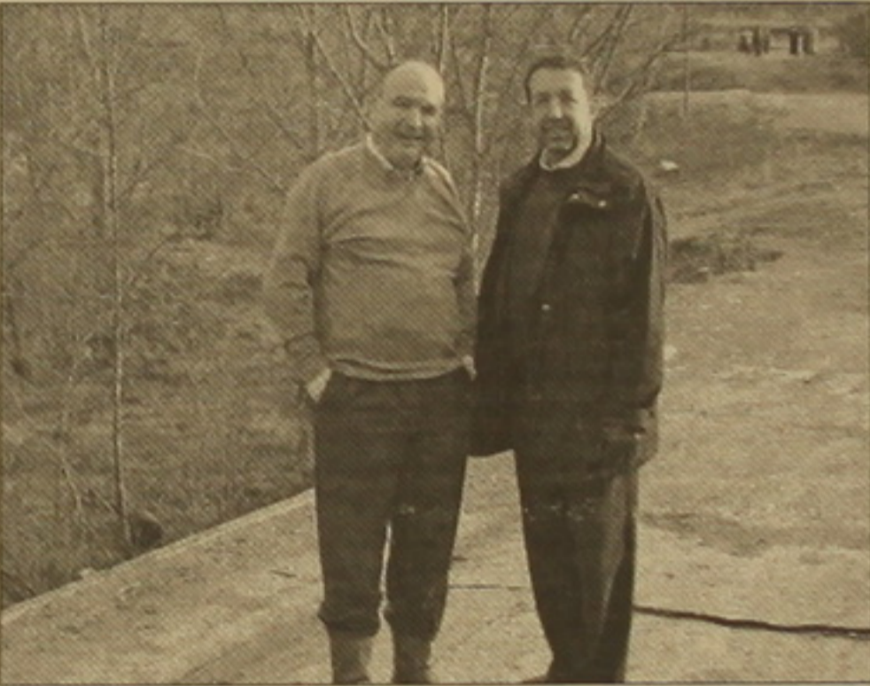
Համանախագահներ Բեռնար Ֆասին եւ Սթիվեն Մանը:

Միսսիսի խումբը եւ ԵԱՀԿ առաքելությունը Զարիստանում