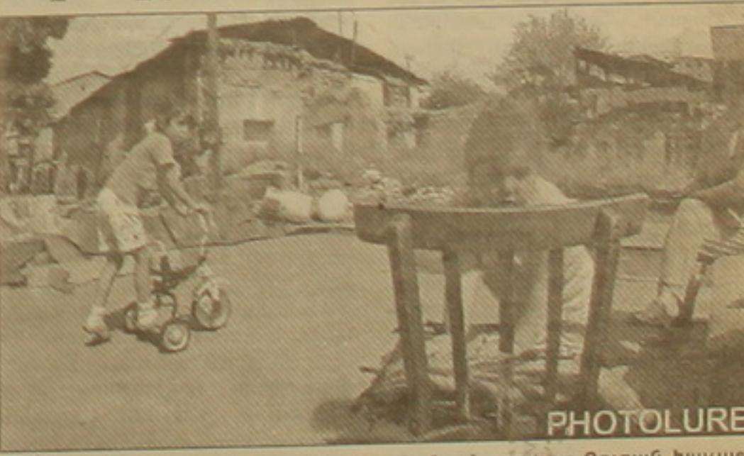
Բուզանդի 15 շենքի բնակիչները տղամանուկ են բերնակում լցնել ԴՅԱԿ-ի աշխատակիցների վրա, եթե հանկարծ հայտնվեն ու փորձեն վստահել իրենց: Այսօր ժամը 19-ին ԳԿ

Դասական ակտիվ հարկադիր կասարան աշխատակիցները երեկ այդպիսի չհայտնվեցին մայրաքաղաքի Բուզանդի փողոցում բարիկադերի խիստ վերջին ընթացիկներին վստահելու: