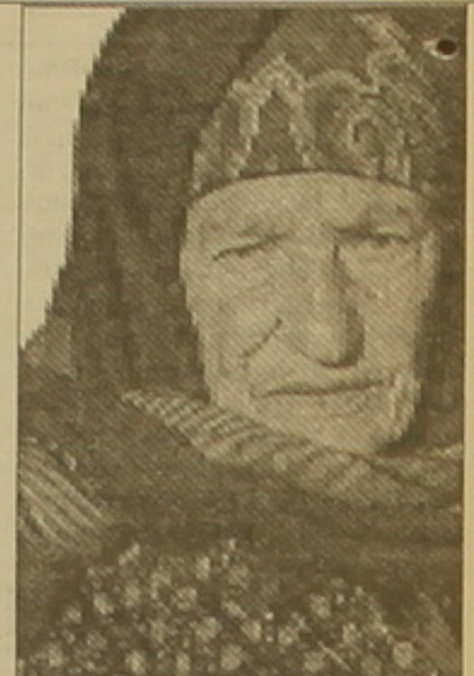
«Իմ որդին լիցի հայ լիցի» ձայն հուզող նույն հարցը. «Չեզ համար ի՞նչ է նշանակում հայ լիցի»...

Դարձյալ Կանադայում նկարահանված «Իմ որդին լիցի հայ լիցի» (ռեժիսոր՝ Ջակոբ Գուդսոն) ֆիլմն սկսվում է հեղինակի կողմից հնչող նույն՝ «Իմ որդին լիցի հայ լիցի» խոսքով: Իսկ կարգում տեսնում են փոքրիկ զոյա՝ գունավոր մաշկներով նկարած Հայաստանի ֆաբրիկ, ուր տեղ է գտել և «ամենայն հայտնով»: Դուրս այն ասածին՝ թե «Արարած Հայաստանի մեջ չէ», մանչուկը աղաչաբար հարցնում է իր դասերից: «Հայաստանի մեջ չէ»: Այնուհետև ֆիլմի հերոսը հանդիպում է Սոնեալուն բնակվող, այդտեղ ծնված մի բարձր հայրենակիցների, որոնց ուղղում է լուրջ ծանոթ և հա-