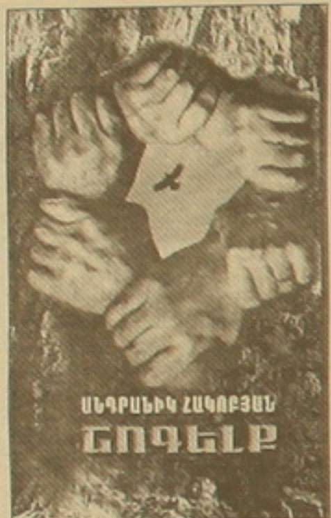
ՍԵՂՈՍԵՆԻ ԶԱԳՐԵՅՈՒՄ ԵՆՈՒՄ

Օրվա արձույթների մեջ, համադարձայն հացի փոսրոսումներում մարդը կարծես հեռացել է ինձ իրենից ու ցրտադասից, դարձել անհարգող, անսիրտ, անարթ: Վստի-գավոր ու անհեռանկար այս գոյությունը առավել թանկարժեքի տիրույթ է, եթե հոգեւոր-մեակութային դրոշմներում ինչ, բայց սեսանելի Երևանում կանգնելը չլինելու: Մի հրաշալի քննադատություն, մի անկրկնելի համեմատ, մի ինձնասիրտ գիր, որ գալիս միանում, ամբողջանում ու ներծծվում են հոգու խանձված Երևանում, ինչպես կենտրոնը՝ խոճակից ճաճված հողի մեջ: Եվ ոգու սովի սղառնային բնավ էլ այդքան մոտ ու սեսանելի չի դառնում, որովհետև գրասեղանիս հիմա Անդրանիկ Հակոբյանի «Շոգելի» (դասվածներ են էստեթիկ) վերագրված գիրն է, որ լույս է ընծայել «Արդյուն» հրատարակչությունը: «Խոփի ղեկավարի եմ անել, ու նամակս չի ստացվում: Ակոս ծոցը ինձ չէ: Ելել մեկն է, կամ ես, որ խոփ եմ՝ կարողվեմ, կամ՝ ֆաղ: Մտածե՛մ, որ սա արձակագիր Անդրանիկ Հակոբյանի կենսակերպն է՝ արդյուն-արարելու՝ ստեղծագործելու իր կերպը, հավասար, որ կուզեք դառնար նաև ընթերցողին: Հաստատ այդպես է, որովհետև իր նամակները՝ դասված են էստե, նրան են ուղղված, իր անհանգստությունն ու սազմադր նրա համար են: «Մեր բարերը բացել են բոլոր փակագծերը, ողջամիտները փորձում են դաժանություններ: Գրողի իր կոչումը այդ դաժանությունը (սեսակի ինձնատաճառությունը) կազմակերպել է, ու ոչ սուկ իրողության արձանագրումը: Մտնով են թերես դայանավորված Անդրանիկ Հակոբյանի արձակի հրատարակչությունը»: