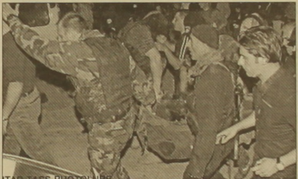
ITAP TASS PHOTO NEWS

Կեղծ նշանակը դարձավ մասնական, հարություններ՝ հարությունյան