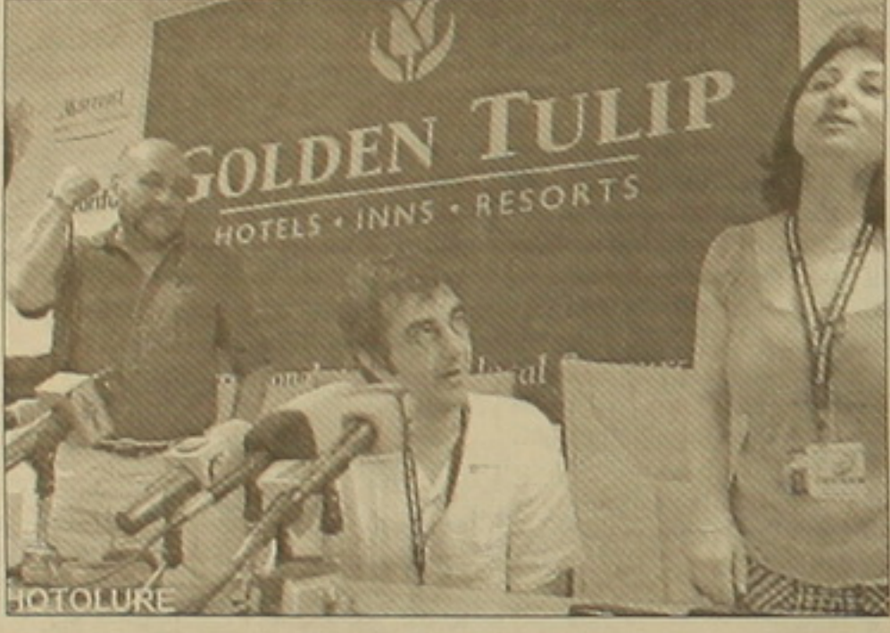
Փառատոնի ընթացքում չի ցուցադրվի նրա վերջին ֆիլմը, քանի որ ռեժիսորը գանկացել է իր բոլոր ուժերը ներդնել ժյուրիի աշխատանքին, իսկ ֆիլմը ներկայացնելու համար բավականին աշխատանք էր հարկավոր: Նա նշեց, որ ֆիլմը ռուսով կարգավիճակում էր հայաստանում: «Այն ստեղծվեց Կաննում ներկայացնելու համար, բայց այժմ էլ աշխատանք են դրա վրա»:

Իսկ Ասոն Էգոյանը համոզված է, որ մենք ունենք թե՛ ենթակառուցվածքներ, թե՛ անհրաժեշտ սարքավորումներ, որ համաշխարհային բարձր մակարդակի ֆիլմեր ստեղծելու համար: Ռեժիսորը կեսկյանակ-կեսուրը խոստովանեց, որ փառատոնի այս սարվա շարքերում ամենիցաւ շատ չի սակայն երբ հասկացավ՝ սովածացավ: