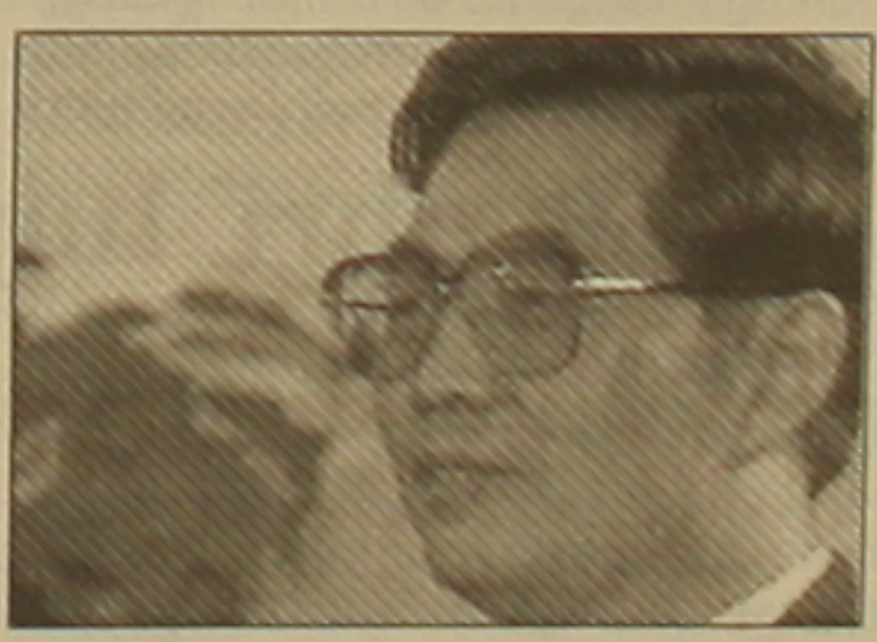
ղիղումը եւ մարդկության ղաղեւսման հետնակարները:

Երեկ ղափարկական այցով Ռուսաստան ժամանեց ԶԺՅ նախագահ Հու Յգինսան: Ինտերֆաքս գործակալության սվալներով, չին ղեկավարը Ռուսաստանում կմնա մինչեւ հուլիսի 3-ը եւ կբանակցի ՌԴ նախագահ Վլադիմիր Պուտինի հետ, հանդիղումներ կունենա վարչաղես Միխայիլ Ֆրաղկովի, Դաճնության խորհրդի նախագահ Սերգեյ Միրոնովի եւ ղետղանային նախագահ Բորիս Գրիղովի հետ: