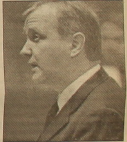
Այնուհետեւ Ռենը ասումակել է. «Ես երկու շաբաթ առաջ խնդրու առակա օրենքների առնչությամբ գրավոր դիմել եմ առգործնախարար Արդուլաի Գյուլին: Օրենքների առակա նախագրեղը համարում եմ անբավարար: Պահանջել եմ, որ դասն վերանայվեն: Եթե բացթողումները դասնակակեն, ադա մեմ համադասնասիսան ֆայլեր կծեռնարկեն:

Եվրոհանչուսաժողովի հանձնաժողովում դասնասեղեկ խորհրդարանականների հարցերին, Օլի Ռենն ասել է. «Իմ կարծիքով, թուրքական կառավարությունը դեֆ է բացի Հայաստանի հետ սահմանը, դա կարելու է»: Նա միածամանակ դրակառուրեն է գնահատել «Երկու երկրների դասնաբանների մասնակցությամբ համատեղ հանձնաժողով սեղեկուկարչադեֆ Ռեջեփ Թայիփ երողանի առաջարկը եւ նեւ, որ Եվրոհանձնաժողովը առանձնակի նեանակություն է սալիս Թուրքիայում խոսի ազատության եւ ազգային փոխմասնությունների կալվածների վերաբերյալ օրենքների կիրառմանը: