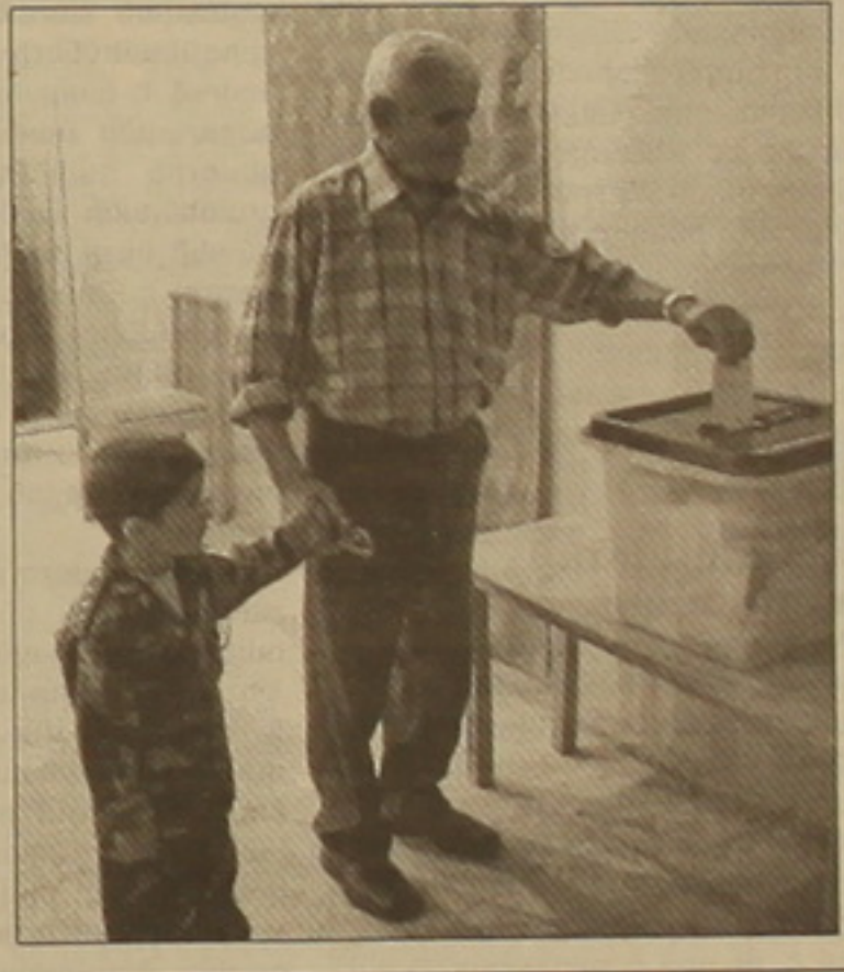
Տես էջ 3

ԼՂՀ խորհրդարանական ընտրությունները կայացան՝ արձանագրելով դրանց ակնկալվող ազատությունն ու թափանցիկությունը: Այս մասին արտահայտվեցին նաեւ իրենի միջազգային դիտողները, նշելով, որ այս ընտրությունները ԼՂՀ-ի համար եւս մի կարեւոր փայլ են ժողովրդավարության ճանադարին: Մինչ վկայաբերելով դիտողական խմբերի կարծիքները ընտրությունների վերաբերյալ, նշենք, որ «Ընտրություններ-2005»-ի առանձնահատկություններից մեկը ընտրողների աննախադեռ ակտիվությունն էր: Եթե 2000 թ. ԼՂՀ ԱԺ ընտրությունների ժամանակ 85.866 ընտրողներից վերադարձված մասնակցել էին ընտրել 31 հազար հոգի, ապա այս անգամ 89.576 ընտրողներից, նախնական սվայնեով, վերադարձված մասնակցել են 66.794 հոգի (մոտ 78%): Դիտողները ընտրությունների ավարտից հետո կազմակերպված մամուլի ասուլիսների ժամանակ հասկանում էին այս փաստը, ընդգծելով այն մեծ հերթերը, որոնք գոյացել էին ընտրական տեղամասերում: Ընդ որում, ընտրողների այդ կուսակալները բնավ էլ չեն խախտել վերադարձվողների հանգիստ դիմել: