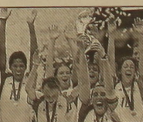
Են նորվեգացիներին: Վերջիններս եվրոպայում միակն են, որ կրում են այդ մայրցամաքի, աշխարհի և օլիմպիական խաղերի չեմպիոնի սիսդոսները:

Անգլիական Բլեյբլոնն փառաբան ավարտվեց ֆուտբոլի եվրոպայի կանոններով անցողիկ առաջնությունը: Եզրափակվեց չեմպիոնի կոչումը վիճարկեցին գերմանիայի և Նորվեգիայի հավաքականները: Խաղն ավարտվեց գերմանիայի ֆուտբոլիստների վստահ հաղթանակով (3-1): Այստիպով, գերմանիայի ընտանիքն չորրորդ անգամ անընդմեջ նվաճեց եվրոպայի չեմպիոնի կոչումը: 1984 թ. անցկացվող եվրոպայի առաջնությունում գերմանիայի ընտանիքն արդեն 6-րդ անգամ անընդմեջ հաղթող ծանաչվեց: Ընդ որում, 3 անգամ գերմանացիները եզրափակվեցին հաղթել