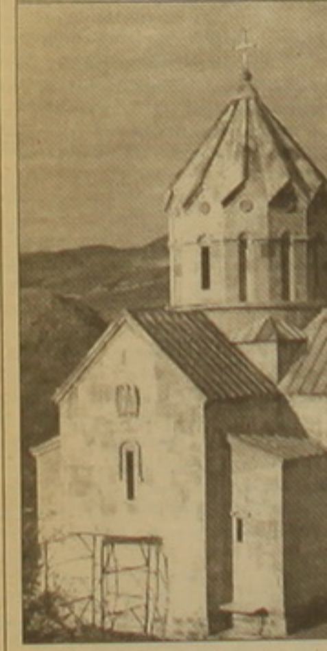
Բերձրոյի Սուրբ Համբարձման եկեղեցին:

իմա մեր տներում մնում են ապրում: Հիշում են մեր տունը, այգին, ուղիղ ճանապարհները», ասում է Անժելա Ավանեսյանը: Բերձրոյ ԼՂՀ Զառաբաղի բնակավայրում կենտրոն է, ձեռնարկվել է 1994 թ., զբաղեցնում է Հակարի գետի հովիտը՝ ընդգրկելով անցյալ դարի առաջին աստիճանային տներում հարյուրյակներում կառուցված Լաչինի, Ղուբաթլուի (այժմ՝ Զառաբաղ) և Զանգելանի (այժմ՝ Կովսական) բնակավայրերը: Աստիճանային Սլավոն Գրիգորյանը, որը նույնպես Բերձրում առաջին հաստատվածներից է, ցավով նշում է, որ իր հայրենի Մարադայի հետ եւ Մարադայիցի բնակիչները 5 գյուղեր արտոնական են մնալ բռնազավթած՝ Մարադայից Ռոզա Ավանեսյանը: