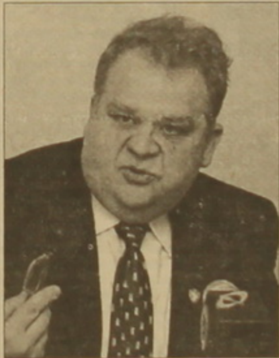
Որ, ոչ էլ ընդդիմությանը: Առաջին հասարակության մեջ լուրջ դժգոհություն կա իշխանություններից, երկրորդ՝ մեր հասարակությունը չի տեսնում ընդդիմադիր որևէ ուժ, որի հետեից ղեկ է գնա: Այս առումով առկա է բարոյահոգեբանական ճգնաժամ:

«Ճգնաժամ» արտահայտությունը սերմին է օգտագործել, եթե խոսքը Ազգային ժողովի մասին է: Չմայած խորհրդարանական մեծամասնությունն աղախվում է նիստերի օրինակությունը, այնուամենայնիվ, ընդդիմության բացակայությունը ոչ լիարժեք է ասելով: Եթե որդեգրված ճգնաժամն իրականում են հակասությունների ծայրաստիճան սրունը հասարակության մեջ, ժողովրդի մեծամասնության կողմից դժգոհության արտահայտումը, ընդ որում, դժգոհության արտահայտման բազմաթիվ եւ բազմաթիվ ձևեր կան, աղախ իրավիճակը ճգնաժամային չէ: Հարցն այն չէ, թե որքան մարդ է գալիս հանրահավաքներին, ինչքան էր հնարավոր, որ գար, ինչպես մեծ թվով ժողովուրդ չի հավաքվում: Առկա է երկու դեպք՝ ճգնաժամ, ինչը, կարծում եմ, դուր չի գա ոչ իշխանությանը, ոչ էլ ընդդիմությանը: Առաջին հասարակության մեջ լուրջ դժգոհություն կա իշխանություններից, երկրորդ՝ մեր հասարակությունը չի տեսնում ընդդիմադիր որևէ ուժ, որի հետեից ղեկ է գնա: Այս առումով առկա է բարոյահոգեբանական ճգնաժամ: