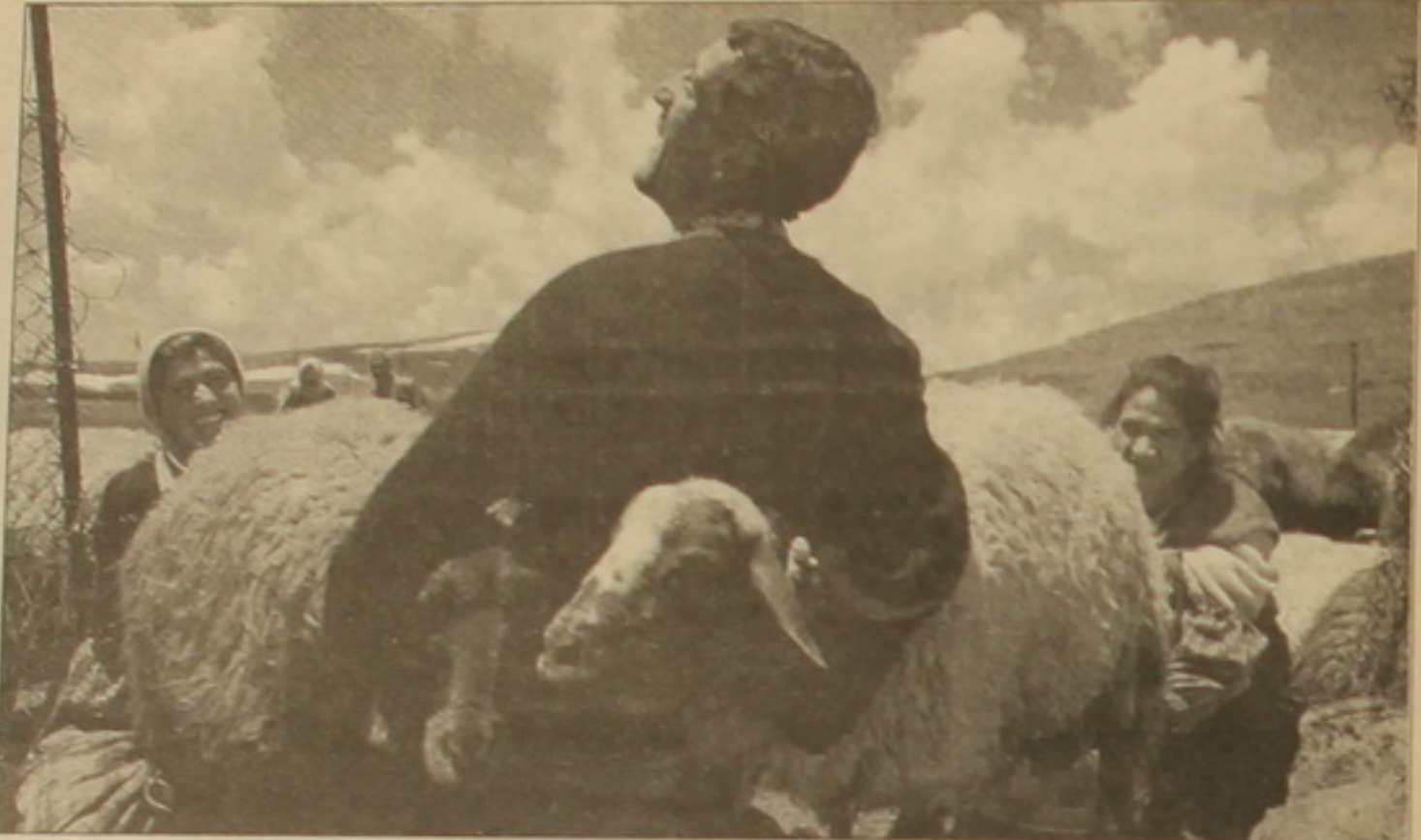
Եզդիները ամենամեծ ազգային փոքրամասնությունն են: Մուսա Արսևյանը՝ Ուրբեմ Մանգասարյանի հետ

Մոլոկանները փչացել են, - ասում է նա, - հարբեցողները շատ են, այլանդակությամբ են զբաղվում: Ոմանք վտարել ենք մեր սեկտայից: Շուրիկը 6 երեխա է ունեցել (3 որդի և 3 դուստր): - Ավագ որդիս