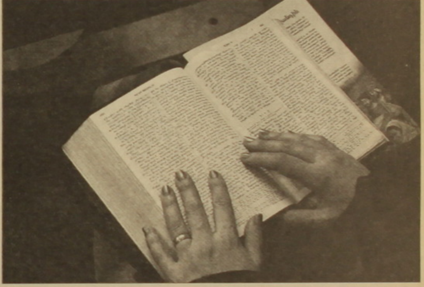
Լույս գրից հետեւել բավարա չէ կրոնական համեմատություն արդարացիության համար

բայց մյուս կողմից, երկիրն ունի իր օրենքները: «Կան երկրներ, որտեղ զինվորական ծառայությունը բոլորի համար էլ 3 տարի է: Մեր երկրում, որը գտնվում է հակամարտությունների գոտում, ծառայել չցանկացող նույնիսկ մեկ-երկու հազար զինվորների պակասը կարող է բացասական ազդեցություն թողնել», ասում է Խառատյանը: Հայ հասարակությունը մեծավ մասամբ բացասաբար է ընդունում աղանդավորությունը, մասնավորապես, Եհովայի վկաներին: Կուսակցությունների մեծ մասը եւ մամուլը քննադատաբար են մոտենում Եհովայի վկաներին: Այսպես, «Մեկ ազգ» կուսակցության առաջ-