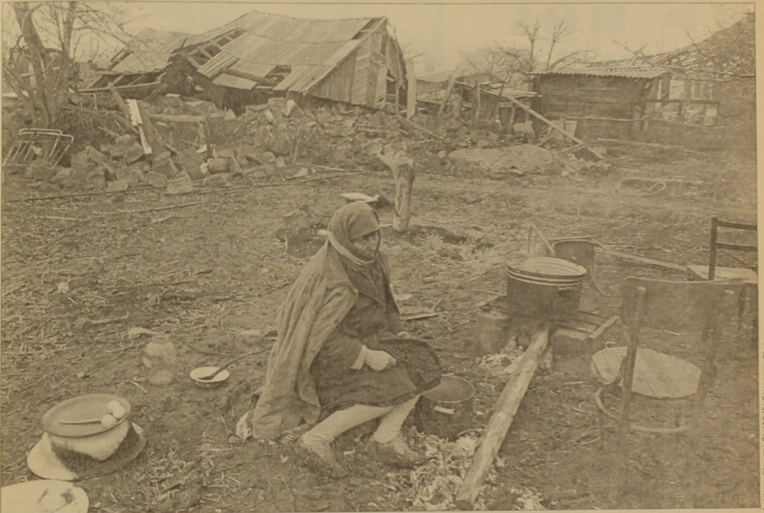
Վերականգնված Կրիմա քաղաքում