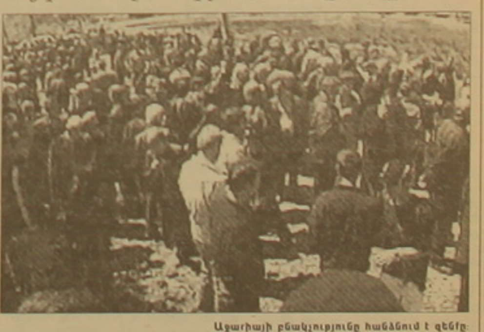
Ազարիայի բնակչությունը հանձնում է զենքը:

Ազարիայում վերացվեց ինքնավարության առաջնորդի ինստիտուցիոն: Այս որոշմանը կողմ էին լիարժեքությամբ ստանձնեցին: Նա հակիրճ խոսեց սարելիցի կառավարությանը կազմակերպվելի միջոցառումների ու հրատարակական աշխատանքների, հրավիրված մոտ 100 հյուրերի այցի, 600 վերադարձներին նյութական աջակցություն ցույց տալու և այլ հարցերի մասին: Ելույթ վերցրեց նա Ընդհանուր Հայաստանի կոնգրեսի ղեկավար Ռուբեն Կարապետյանի հետ մասնագետները լիարժեքությամբ ստանձնեցին: