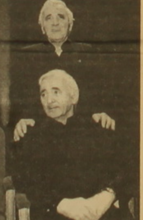
ժեկը բազմաթիվ հայտնի արվեստագետներ: Այնտեղ էին նաև ինքը Շաղ Ազնավուրը, իր փուլը Սիդա Կատարեզը, ղուսսը Կասյան, իմպրեսարիո Լեոն Սայանը և այլ մեծարվորներ: Պ. Բ.

Շաղ Ազնավուրի երկրորդական համար հաճելի անակնկալ դարձավ Փարիզի «Գրեվեն» թանգարանում նրա անչափ բնական կանգնակի տեղադրումը մի ասի ալը նախակր անձանց ֆանդիների կողմից: Փարիզի «Աւխարի» քերթ տեղեկացնում է, որ ֆանդակագործ երկը Սեն Շաֆեն իր վերջին աշխատանքը կերտելիս դրան սվել է յուրօրինակ արտադրություն: Ազնավուրի ոչ բոլոր երկրորդականներն ընդհատվել են: Մակայն ֆանդակն իրականում արվեստի հաջողված գործ է: Օգտագործված նյութը բնական մեղրամոմ է: Դրա ընթացումը դասախանակն չէ, այլ դաշնակազմակրված է նրանով, որ մեղրամոմի կառուցվածքը զարմանալիորեն նման է մարդու մաշկի կառուցվածքին: Բացի դրանից, ժամանակի ընթացումը մեղրամոմը ոչ սեղմվում է, ոչ էլ գունափոխվում: Բանդակի բացման նախօրեին քանդարանի թատրոնում տեղի ունեցած երկրորդական ներկա են ե-