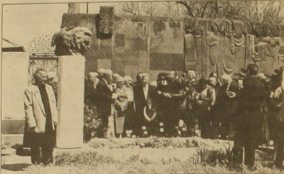
Մայիսի 27-ին Կոմիսասի անվան զբոսայգու դահլիճում, Շիրազի շիրմի մոտ տեղի ունեցավ հանդիսավոր արարողություն՝ նվիրված բանաստեղծի ծննդյան 90-ամյակին:

Արարողությունը ներածական խոսով բացեց եւ նախաստեղծ միջոցառումների մասին ներկայների տեղեկացրեց ԳԳՄ նախագահ Լեւոն Անանյանը: Այնուհետեւ խոսեց բանասիրական գիտությունների դոկտոր, դոկտոր Սամվել Մուրադյանը, բանաստեղծներ Սատուն Գրիգորյանը, Գրիգոր Կարծիկյանը, Գրիգոր Եղիազարյանը, արձակագիր, բանասիրական գիտությունների դոկտոր Շավիղ Գրիգորյանը: Շիրազի բանաստեղծություններից արձայնացրեց փոփոխ Մարգարիտը: