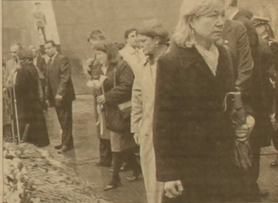
Դեսպանը (մեջտեղում, ծաղիկներով) մոտենում է հավերժական կրակին:

նամակը հրատարակել, խնդրում են հասցեագրել Ուոլ Վիլսոնին՝ մեր դեսպանության ղեկավարի տեղաւակին: Գեոգրիկները ղեկում են դրանք կկարգան դեսպանություն վերադառնալուց հետո՝ մարտի 26-ին», գրել էր դեսպանը: Ինչպես նշված է ղրք Սասունյանի բարգձմանքար ներկայացված հողվածում («Ազգ», 22 ապրիլի, 2004), իրեն ուղղված բողուները գլուխը կորցրած դեսպանը Երթոթ է ամիսներ, եւ ենթադրելի է, որ նամակում