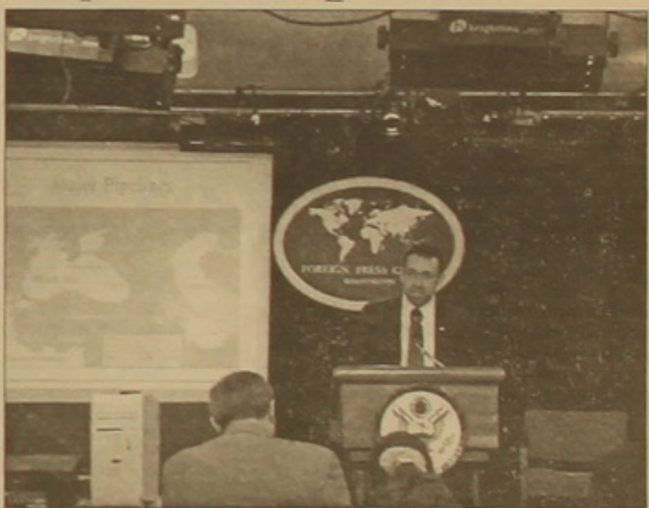
Տես թք 2

Սև Պրեքանի դասախանության նախարարի վերջերս ԱՄՆ այցելության արդյունքներին: Արիեւն ասել է, որ ԱՄՆ դասախանության ֆարսուղար Դոնալդ Ռամսֆելդը Ղարաբաղյան կարգավորման հարցում կողմնակից է փուլային կարգավորմանը: Հարնիցը հեքարհրվել է նաև Աբիեի այն հայտարարությամբ, թեք հայ-ադրբեյջանական նոր դասախանը կարող է սկսվել ցանկացած դասին: Արիեւր բացաքել է, որ նոր դասախանը կարող է սկսվել այն դասախանով, որ Հայաստանի իշխանությունները կորցնում են երկում իրավիճակի վերահսկողությունը: Բացի այդ, ըստ Աբիեի, հայերը ջանք ու եռանդ չեն խնայում խոչընդոքելու Բաբու-Թրիլիսի-Չեյիան նախարարի կատուցման աշխատանքներին: