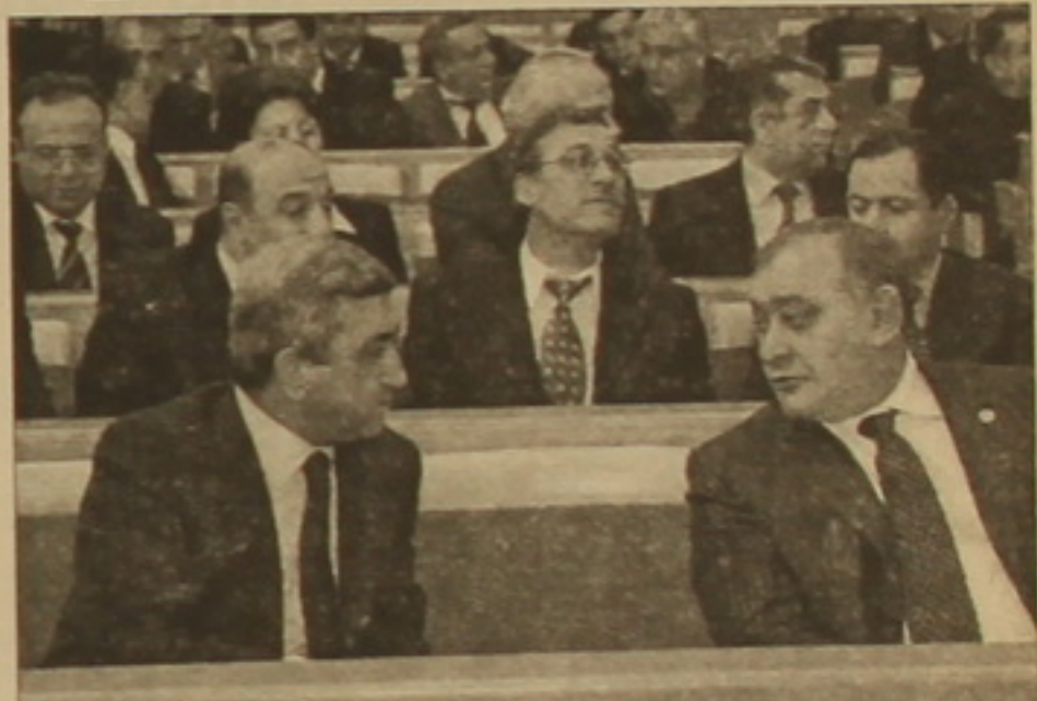
Կան մարտավարության գլխավոր դերակատարներից երկուսը վարչապետը եւ լուրջագրողության նախարարը ներհարկական իրականության մույն բնութագրիչը սվե:

ՎԱՐՄԱՆ ԳԱՆՔԵՆՈՒՆ. Ներհարկական կյանքում իրադարձությունները զարգանալու միտումներ են ցուցաբերում, սակայն բովանդակային էությունը նույնն է: Ընդդիմությունը ֆանիցս հիշեցնում է իր լուրջագրողը, իշխանությունները վանում են: Երկուսն էլ խոսում են սահմանադրական կարգը լուրջագրողներին, օրենքի լուրջագրողներին չզայլու անհրաժեշտության եւ բացառապես այդ սահմանում գործելու հաստատվածության մասին: Եվ առերեսով Հայաստանի ֆաղափանցները անհանգստանալու լուրջագրողներ կարծես թե չունեն: Փոխհրաժեշտությունն առայժմ արտահայտվում է միայն փոխադարձ վիրավորանքների մեծ կամ փոքր չափաբանակներով, ձեռքարկություններով, ապագա արյունոտ բախումների վստահավոր հեռանկարով: