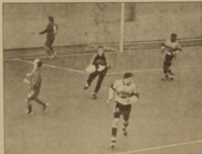
Նրիայ Մալալ (43), Վարզազյան Ավեսիսյան (48, 75): «Փյունիկ»-«Արարատ» Մ., Ռուսաստան 2-6 Մրման Քարամյան (18), Նրիայ Մալալ (90):

Այսօր Մոսկվայում մեկնարկում է Ֆուտբոլի ԱՊԳ եւ քաղաքային երկրների չեմպիոնների «Համագործակցության» գավաթի 12-րդ խաղարկությունը: Մրցաշարի անցկացման ժամանակահատվածում մեծ առաջին անգամ կազմակերպվեն չի հաջողվել հովանավոր գտնել, ուստի մրցանակային հիմնադրամն այս անգամ բացառաբար է կազմակերպչական բոլոր ծախսերը հոգացել է Ռուսաստանի Ատլետիկայի կոմիտեի: