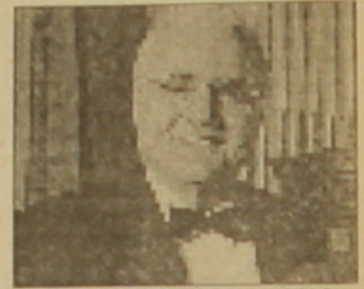
Կի Միխրայան միաբանության եւ Հայաստանի նախագահի կողմից: 1970 թ. ժամկոչյանը ստեղծել է «Կոմիտաս» երգչուհային հիմնադրամը, որի շնորհիվ երեանի մի շարք համերգադաշտներում օժտվեցին երգչուհիները:

Փետրվարի 23-ին Մասաչուսեթսում մահացել է ամերիկահայ աշխարհահռչակ երգչուհի Պերձ ժամկոչյանը: Երբեք էլ ամերիկացի առաջին երգչուհի չէր հասնում, որը 1965 թ. համերգային շրջադարձը եղել է հորհրդային Միությունում: Համաշխարհային սիմֆոնիկ նվագախմբի հետ նա ունեցել է մի շարք համերգներ: