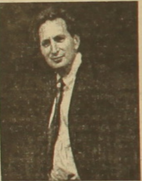
կարգի ճնշումների է առաջնորդում»:

փաստերը, Ռասելը բնական է համարում, որ նրանում զարթնած խռովակույզ խղճի դեգերումներն անխուսափելիորեն հանգեցնելու էին «Այրվող Տիգրիսին»: Անգլո-ամերիկյան գրականության եւ զանազան աղբյուրների ու ուսումնասիրությունների իմացությունը մեծադեմ նդասել է նրան գրելու այդ գիրքը: Նա մեծ տեղ է հատկացրել անգլիացի եւ ամերիկացի դիվանագետներին, մակարակներին, հոգեբուական-միստիկներին արեւելյան չափերի հասնող «համընդհանուր կարեկցական խոսքերին, որոնցով նրանք մաշակում են հայերին օսմանյան բարբարոսությունների մղձավանջային տարիներին»: Հայաստանն այդ ժամանակ դարձել էր «բարոյականության առանցքային թեմա ամերիկյան հասարակության համար, եւ Բալախանը կարողանում է անհերքելի փաստարկն առաջ առնել, որ հեռավոր մի երկրի ճնշված ժողովրդի հանդեմ դասախառնակության զգացմունքի այդ արտահայտությունները հիմն ծառայել են հեռավոր սկզբնավորելու մարդու իրավունքների ժամանակակից շարժումը», գրում է Ռասելը եւ ավելացնում. «Պատերազմի (Առաջին համաշխարհային) ավարտին նախագահ Վիլսոնը հայտարարեց «Պե՛տ է փոխհասուցել Հայաստանին»: Բայց, ինչդեռ Բալախանն է մասնագետը, ոչինչ չկարողացավ ազդել ամերիկյան ֆալսիֆիկացիոն