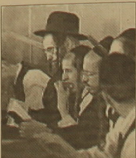
ղիտ ֆարսերով: Ուղտաղափառների, այսպես

Չրեա ուղտաղափառների ղախանջով Իսրայելի գլխավոր բանկերից մեկը՝ «Լյուսին», շուտով կորոզարկի նոր կրեդիտ ֆարսեր, որոնք գործածելի չեն լինի ուրաք երեկոյան եւ շաբաթ օրերին: Բանկի ղեկավարների ասելով, իրենք դա արել են «Եւրոպայ» խոստով ղախանջով, որովհետեւ այդ օրը նրանց արգելվում է որեւէ ֆիզիկական աշխատանքով զբաղվել: Օրինակ, նրանց չի թույլատրվում մեքենա վարել, զանգահարել հեռախոսով, լույսը վառել կամ հանգցնել եւ այլն: