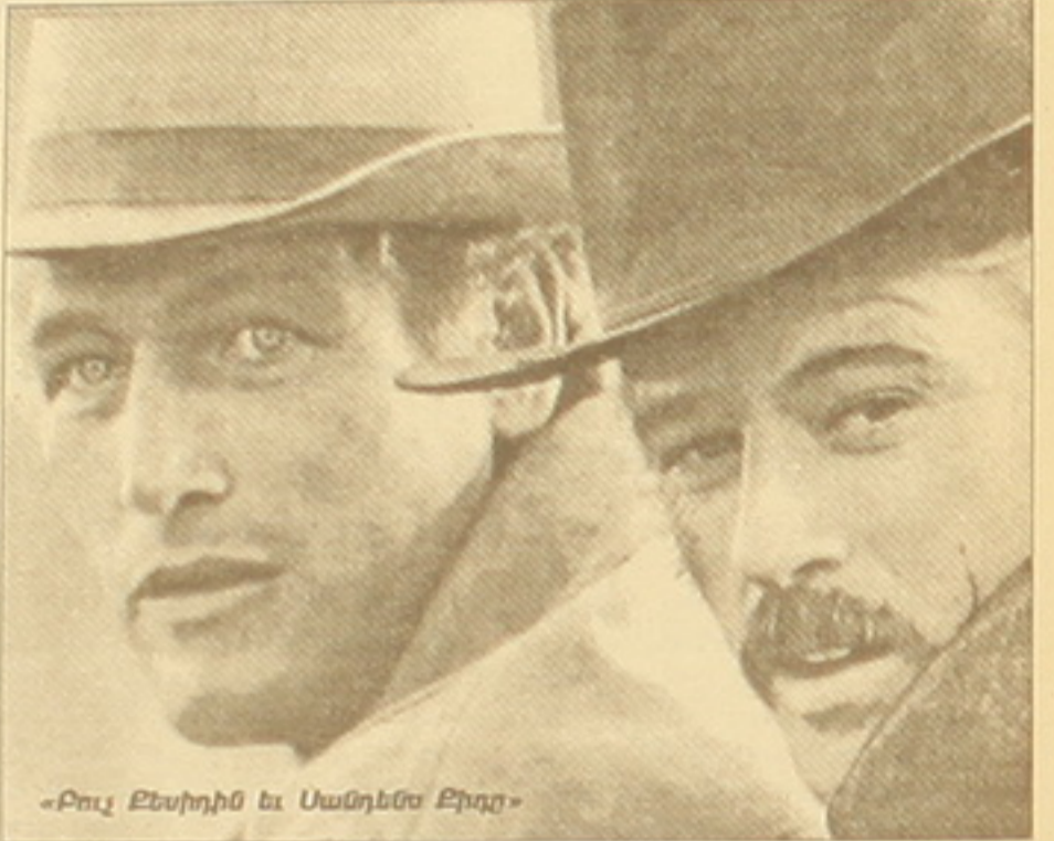
«Բուլ Բեյդիմ և Սանդրա Բլոգ»