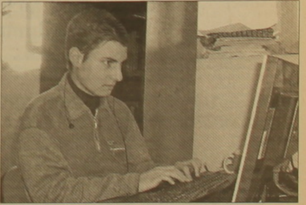
Մրցությունը հաղթած երիտասարդ «Լայկոսում» ընդունվել է աշխատանքի:

Ինչպես արդեն հայտնի է, թե ինչու և երբ կստանա 300 մլն դրամ: