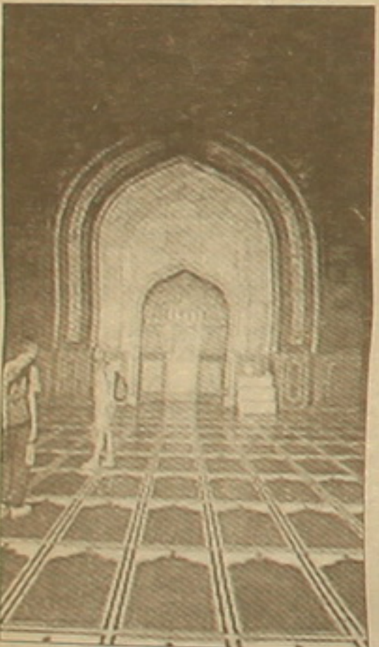
Տաճարի մեծի սրահը

րեստորան լուսավորչի դրվագված է գունազեղ փայտով: