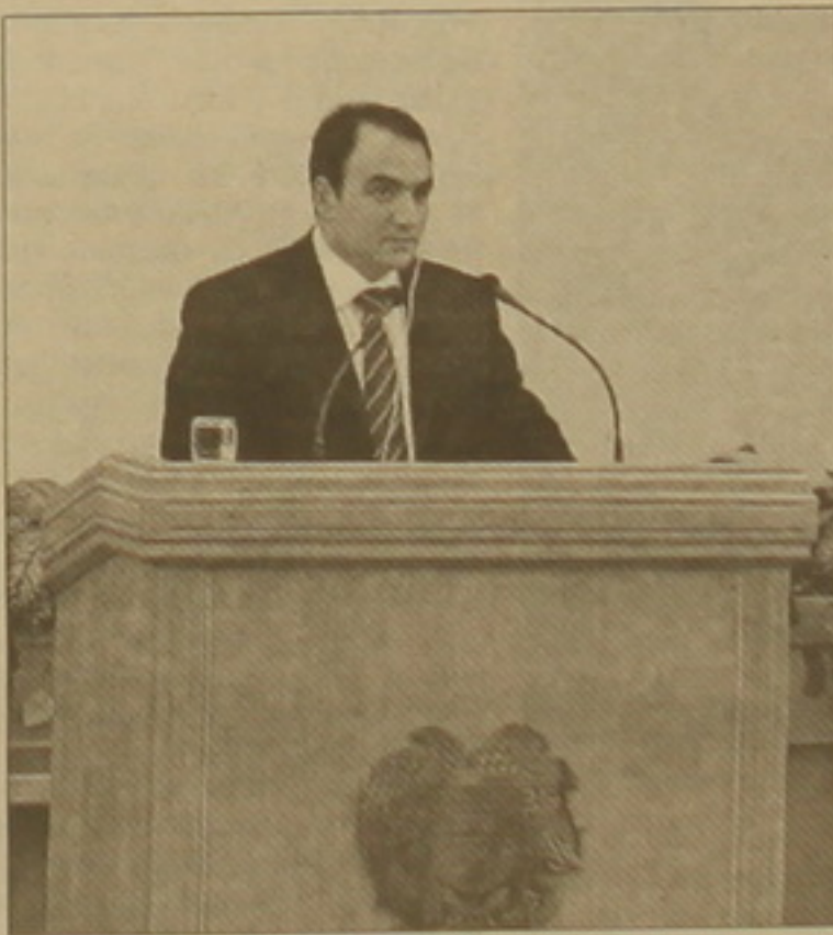
Աժ նախագահը ելույթի ժամանակ:

Աժ օրենսդրական գործունեության վիճակագրական վերլուծությունը ցույց է տալիս, որ Աժ աշխատել է բավականին ծանրաբեռնված եւ արդյունավետ: Այլ խնդիր է, որ միջոց չէ, որ բոլոր լիարժեքավորները մասնակցում են օրենսդրական գործունեությանը, եւ մեծ չէ այն լիարժեքավորների թիվը, ովքեր զբաղված են ամենօրյա խորհրդարանական գործունեությամբ: Սա եւս մեկ անգամ մեզ բերում է այն համոզման, որ մենք լիարժեք է մասնակցում խորհրդարանում տեղի ունեցող