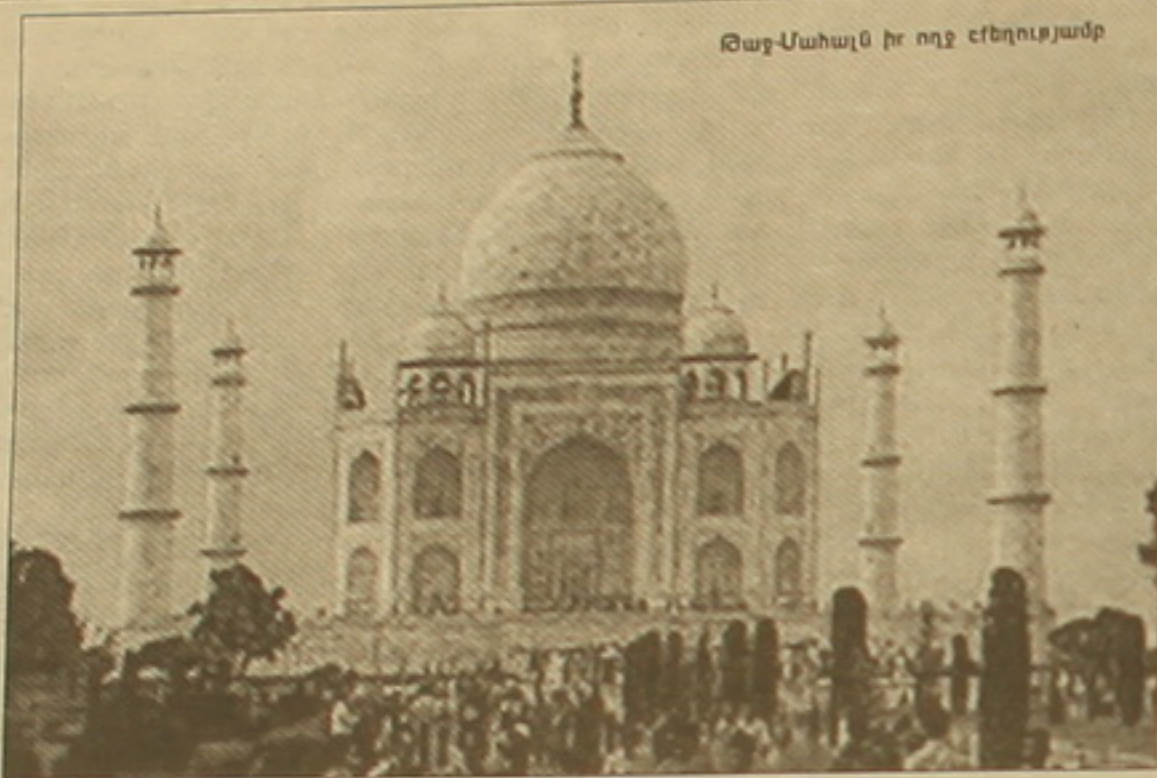
Թաջ-Մահալն իր ողջ շքեղությամբ

Բրիտանացի ճանապարհորդ Էդվարդ Լիքը XIX դարում Հնդկաստան այցելելուց հետո գրել է. «Աշխարհում մարդիկ բաժանվում են 2 խմբի՝ Թաջ Մահալը տեսնելու և այդ երջանկությունը դեռ չաղորածների»: