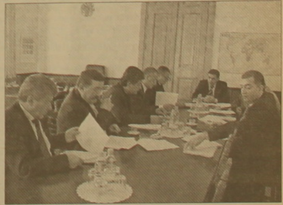
Արտաերթի հարաբերությունների հանձնաժողովի նիստի ժամանակ:

Համառոտ ամփոփելով այս բաժնի օրոք իմ նկատառումները՝ տեղի են համարում մեջբերել մեծ փոփոխություններից մեկին. «Խավարն անփոփոխ փոխարեն գտնե մեկ մոտ վառներ»: Այն մարդիկ, ովքեր օրենսդրական փոփոխում են