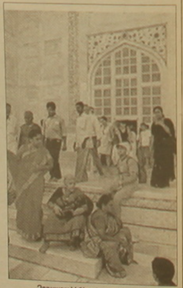
Ձրոսաբեղիկներով լի հրադարակը

նով, որ վարդերների կեսից ավելին, փորագրողներն ու բանվորները, ինչպես նաև գլխավոր ճարտարապետը Հնդկաստանից էին: