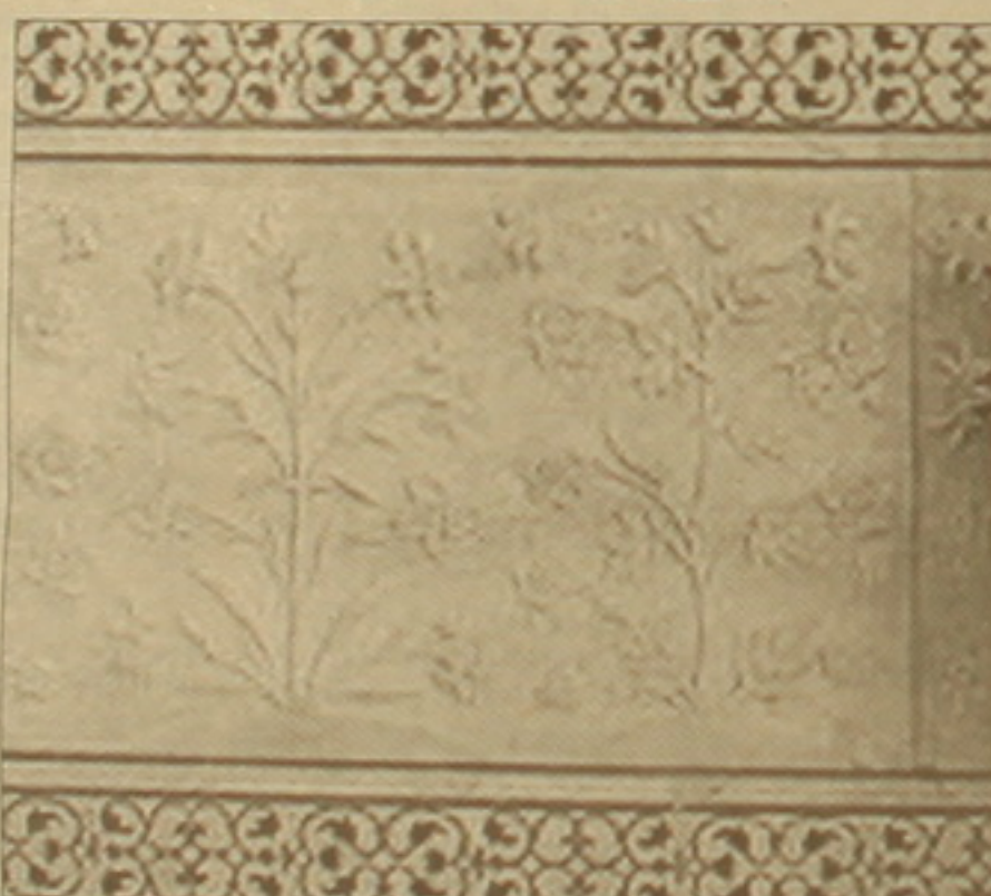
Արձաթյա մեխակներով դուռը

Երկու տարի անց նրա կարգադրությամբ սկսվում է Մուսազ Մահալի դամբարանի շինարարությունը: Դրա ստեղծման վրա 18 տարի աշխատում են 25 հազար բանվորներ, նկարիչներ, ֆանդակագործներ: Եսա Տահանը խորհրդի է հրավիրում արեւելյան աշխարհի լավագույն ճարտարապետներին: Նա կամենում է այնտեղի կառույց ստեղծել, որի մեջ չկար ու չէր լինելու: Երկար ընտրությունից հետո, ի վերջո կանգ է առնում հնդիկ ճարտարապետ Ուսադ Իսայի նախագծի վրա: Սկզբում լուսավորչի մահի դամբարանի փայտե մանրակերտը, ու երբ այն համընդհանուր հավանության է արժանանում, սկսում են շինարարությունը: Դրա կառուցումը լուսավորչի կարծիքով ունեցող իրադարձություն է համարվում: Եսա կամենում է սիրելի կնոջը հավիտենական հանգիստ տալ և սիրելի կնոջը հավիտենական հանգիստ տալ և սիրելի կնոջը հավիտենական հանգիստ տալ և սիրելի կնոջը հավիտենական հանգիստ տալ: