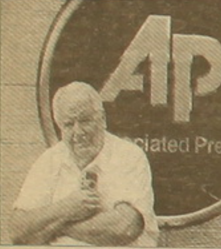
Չարի իր նախնական «Կողակով»։

բարձրաստիճան կառավարական անդամների հետ։ Ըստ դեղատետրում նրա լուսանկարները որակվել են «Եսկյուրիզի», այսինքն՝ «եզակի», «բացառիկ»։ Դրանցից է, օրինակ, Հոսանքի թագավորի 4-րդ անուանությունը լուսանկարը, որը տպագրվել է «Նյու Յորք թայմս» առաջին էջում։ Իր արտասովոր ունակությունների համար էլ բազմիցս դարգեացնվել է