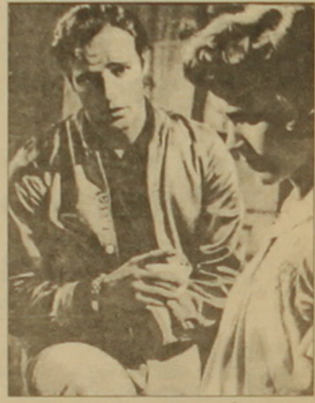
«Գանկություն անունով տանվալը»