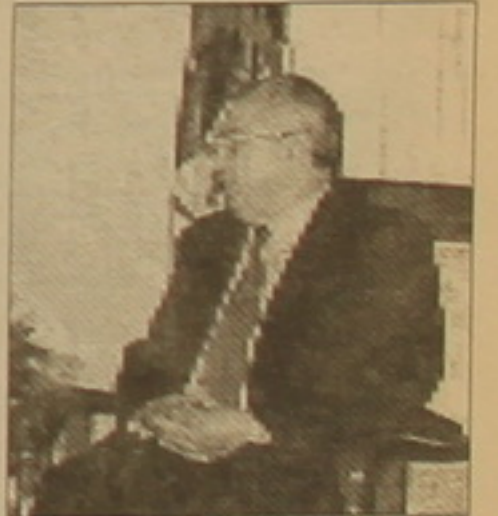
Պաղեստինյան աղբյուրները կարծում են, որ Ջաղդումինը նշանակումը կհանգեցնի ՊԱԿ գործկոմի գլխավոր ֆարսուղար Աբու Մազենի ֆաղական կարիերայի ավարտմանը, մինչդեռ վարչադես Ամնոլ Կորեին կղառնա Պաղեստինի առավել ազդեցիկ ղեմերից մեկը:

Յասեր Արաֆաթն իր ֆաղաֆական կսակը հանձնել է կնօղը և ՄԱԿ-ում Պաղեստինի ներկայացուցիչ Նասեր ալ Ջիդվային, որն իր ազգական է: Սղասվում է, որ Ջաղդումինը կզբաղեցնի ՊԱԿ նախագահի Պատենը, բայց հանդես չի գա որդես Պաղեստինյան ինֆնավարության Պատենական ղեկավար, ֆանգի արմասական հայացքներ ունի: Դեմ արահայտվելով 1993 թ. Օսլոյում Իսրայելի հետ կնֆված հաշնոլային միջակա համաձայնագրին՝ Ջաղդումինը ավելի ֆան 10 տարի արդում էր Թումիսում: Նա ֆանիցս դրվաել է Իսրայելական բնակավայրերում Պաղեստինցիների կատարած ահաբեկչությունները: