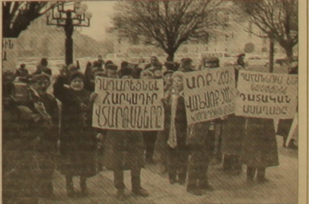
Չիաղողվեց սասնալ այն գումարը, որ իրեն ին ուզում, ԾԻԳ-ը վճարեց

Հյուսիսային ղողոցայի օուրը կրկեր թե՛սանում են: Երկվա օրը հազեցած էր իրադարձություններով: Մի Իսրայի ընտանիքների վարեցից, բողոքի ցույց տեղի ունեցավ կառավարության շինարարության իրավաբանական վարչության թե՛ս Սեդրակ Սեդրակյանը: Մական, խոսք չի եղել Սասնորույում կոնկրետ հանդիպման մասին, առավել եւս, որ մինչեւ վերջին ժամանակները Որոշեր Բոչարյանը չէր թախանջանվում մեկնել Սասնորույ, նեւ է Մերկվալովը: «Եւ չի կարող նման բան ասել: Զգիտեւ, ինչով են թախանջանվորված այդ լուրերը», նեւ է Ռուսաստանյան համաձայնախաղահ: