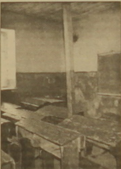
Ախալալայի Դիլիկա գյուղում դպրոցը փակված է: Ահա այս սյունն է ազակերների հույսը:

«Վրացներն սովորեցրել էր փոխվել չէ, բայց սիմոնը կարող է քերել ծոլման: Թրիսիսիում ունենի 100 հազարից ավելի հայեր, որոնք գերազանց սիրալուծ են վրացներին: Զանխն ունեն դատարան: Լեզվի չիմացությունը դասճառ քեր-