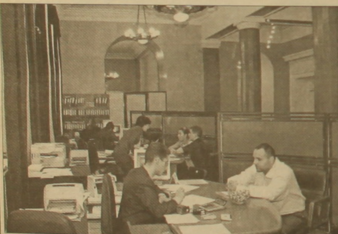
Լուրջ գործարժեքի դաս երեսապարտ հաճախորդների համար: