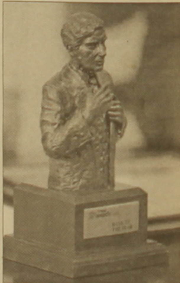
«Տարվա լավագույն բանկ» միջազգային մրցանակ: