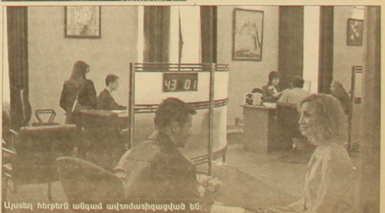
Այստեղ հերթերն անգամ ավտոմատացված են: