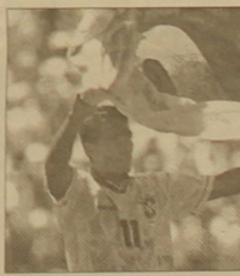
Աեխարիի 1994 թ. չեմոյիոն ու լավագույն ֆուսբոլիստ Ռոմարիոն Բրազիլիայի հավաականի կազմում հրաժեեեի խաղ կկազմակերպի: Այս սարկա նոյեմբերի 10-ին նա վերջին անգամ կկրի երկրի ազգային հավաականի մարզաաղալից: Այդ օրը Լուս Անցելեսում կմրցեն Բրազիլիայի եւ Մեխիկայի հավաականները: Ռոմարիոն անվանել է այն ֆուսբոլիստներին, ովքեր կմաս-

նակցեն իր հրաժեեի հանդիմումը: Նաանց թվում են 1994 թ. աեխարիի չեմոյիոններ Տաֆարելը, Ժորժինյոն, Բրանկուն, Ռիկարդո Ռոեան, Դուեզան, Մաուրո Սիլվան, Մարսիո Սանթոաը, Մազինյոն, Բեբեեոն, Ռայը եւ ուրիեներ: «Դա հիանալի տոն կլինի, որով կնեեմք աեխարիի առաջնությունում տոնած քազիլացիների մեծ հաղթանակի 10-ամյակը եւ իմ հրաժեեը հավաականից: Գնաաղոր է, ֆուսբոլաեերները խաղաղաեոան եեեեե Ռոմարիո-Ռոնալդո հարձակվող զույգին, եթե խաղին մասնակցի «Ռեալի» ֆուսբոլիստը: Դա իմ համար մեծ երազնություն կլինի, իսկ Ռոնալդոյի համար՝ մեծ Պաեիվ», նեել է Ռոմարիոն: Ռոմարիոն բնակ էլ հրաժեե չի սալիս ֆուսբոլին: Նա մաղիր է Ռիո դե ժանեյրոյի քիմում հանդես գալ միմեել ընթացիկ մրցաբարի ավառը, թեե հանաաայե ֆուսբոլիստին 1998 թ. անընդաաե հեծաղում են վնասվածները: