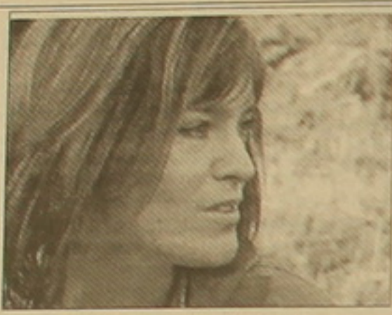
«Արամուս» ծրագրի մասնակից ավսրհացի մասնագետների 36 հոգանոց խմբի մեջ կան հնագետներ, մարդաբաններ, ճարտարապետներ, լեզվաբաններ, նաև ուսանողներ, որոնցից շատերն առա-

Շուրջ մեկ ամիս Արամուս լեռան լանջերին ավսրհացի մասնագետներն ուսումնասիրություններ են կատարում: Ավսրհական Չայցըրուզի համալսարանի և Երևանի Պետական համալսարանի Պատմության ֆակուլտետի միջև կնքված համագործակցության լուրջագրի շրջանակում ավսրհացի մասնագետները հնագիտական-հետազոտական հնգամյա ծրագիր են իրականացնելու ԵՊՀ Պատմության ֆակուլտետի դեկան Չայլ Ավեսիյանի, ավսրհական-հայկական միության նախագահ Փիլիպ Չայրիի և հնագիտության դոկտոր Վիլհելմ Ալինգերի և բանասիրության դոկտոր ժամին Դում-Դրագուբի ղեկավարությամբ: