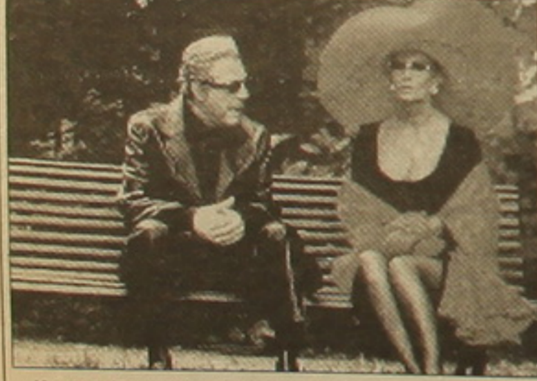
Մարչելո Մաստրոյանինի հետ «Բարձր նորանկարներ» ֆիլմում

հանձն էր առնում աղաիկել իմ ազատ մուսն ու ելք Իսպաղա: Համաձայնությունը կնեցեց, ու թեե դաստատական օրջանները երախավորում էին իմ անվստաղությունը, խոստովանում եմ, որ խիտ անհանգիստ էի: Իհարկե, երկուդ լիովին անիմոն դուստ եկավ: Կարաքիններեի փոխարեսն ինձ սղատում էր փառատոնի ուրախ ու մղոտն բազմությունը, որ թափահարում էր ծաղիկներն ու թակնակները՝ վանկարկելով ազգանունս: Երբ երկուդան հայտարարվեց, որ Սոֆի Լորենը ճանաչվել է լավագույն դերասանուհի, սիրս թղրաց: Ես հայտնվեցի քեմում՝ ինձ ողջունող հանդիսականների առաջ եւ մրցանակն ստանալիս աղբեցի հույզեով ու աղբումեով լի ամենաիմասալի վայրկյանները: Ազգակցներիս սրազին ընդունելությունը լավագույն դասախառն էր իմ աչքում այն ծանր դարձալանին, որը բաժին էր հասել ինձ: Այդ դրանից հասկացա, որ մի փոքրիկ տղ եմ գրավել հայրենակիցներիս սրտում եւ գիտեմ, որ առաջվա դես գրավում եմ այդ տղը: