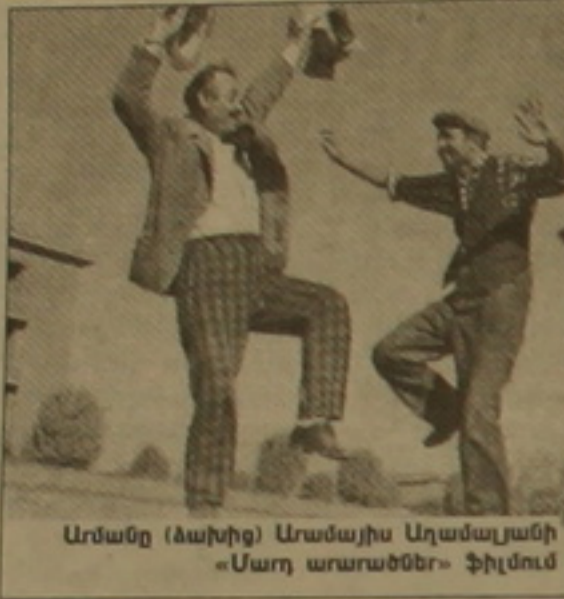
Արմանը (ձախից) Արամյան Աղամայանի «Մարդ արահածներ» ֆիլմում

Նորանցիկ անոանը Իրանի կինոթանգարանը, ի դեպ, արդեն երկրորդ անգամ, Թեհրանում կազմակերպել էր «Հայերը եւ իրանական սինեման» ցուցահանդեսը, ինչպես նաեւ նույնանուն վերագրով կինոնախագիտական (հուլիսի 10-16): Այս ուշագրավ ձեռնարկումները հովանավորել են, ի թիվս այլոց, Հայոց թեմի խորհուրդը, «Ֆարաբի Սինեմա» հիմնադրամը, «Ալի» օրաթերթը, Իրանի կինոարխիվը, իսկ աջակիցներն են դարձել Անահիտ Աբադը, Սուրիկ Արնոսյանը, Արմեն Պետրոսյանը, Հենրիկ Խաչատրյանը, Յուրիկ Զարիմ Մասիհի, Ռոբերտ Սաֆարյանը եւ Արսեն Մարտիրոսյանը: Ցուցահանդեսում, որը ձեռավորել է Մոսսաֆա Դաւթին, տեղ են գտել իրանական կինոյում հայերի գործունեությունը հավաստող բազմաթիվ հետաքրքիր վավերագրեր՝ լուսանկար-