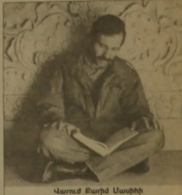
Վարուժ Զարիմ Մասիհի

Օրինակ, առաջին աշխարհագրական ֆիլմերը նկարահանել են հայերը՝ Գեորգ Էսմայիլովը՝ 1909-ին: Հայերն են հիմնել առաջին կինոսահունքը (ժամանակակից տեսուկ) մի շարք հայրերում, իսկ Թավրիզի «Սուրբ սինեման» հիմնել է Ալեք Սազիմյանը 1917-ին: Հայերն են ստեղծել նաեւ կինոնախագիտական կենտրոնները երկրում. Կինոդեպարտամենտը հիմնադրել է Ավանես Օհանյանը 1930-ին: Հայերն են նկարահանել առաջին գեղարվեստական ֆիլմերը՝ «Աբին եւ Ռաբին» (1931) եւ «Հաջի աղան» կինոդեպարտամենտը (1934), որոնց երկուսի ռեժիսորն էլ Ավանես Օհանյանն է: Հայերն են ձեռավորել կինոցուցադրման առաջին շենքերը. «Դիանա» (Երեւան)՝ Սե-