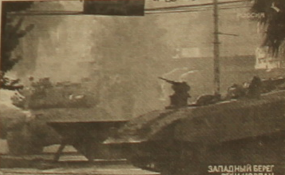
ՅԱՊԱԿՈՒՅԻ ԲԵՐԵՂ ԲԵԿԻ ՈՐԴԱՄ

տության նախարար Իսրայել Կազըլ արտահայտել են Պաղեստինյան ինֆորմարտության ղեկավար Յասիր Արաֆատի արտահայտած օգտին: Հիսուս Զիլսուսի ծննդավայր Բեթղեհեմը Այսրիողանանի այն սակավաթիվ բնակավայրերից է, որոնցից իսրայելական բանակն անցյալ հուլիսին դուրս է եկել ակնի վաղ կնիված համաձայնագրի դաժակներին համադասախան: Սակայն իսրայել-