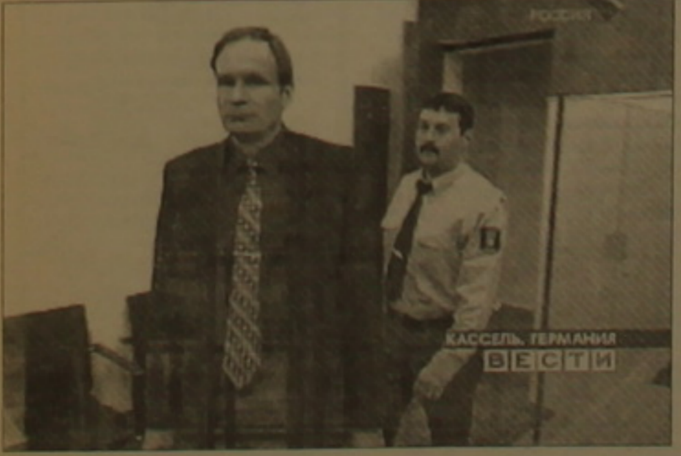
Ամյա բեռլինցի համակարգչային մասնագետին սղանել է, բաժանել մասերի ու կերել: Դասավոնի կայացման ժամանակ գլխավոր բարձրագիցի համարել այն հանգամանքը, որ մարմինն անդամահատելիս սեւ-վիզելո նկարահանել՝ հետագայում դիտելով համույթ ստանալու համար: ԱՆԱՏՆ ՏՎՈՐԵՅԱՆ Գեւորգյան

Սակայն նախարարության ներկայացուցիչը չվիճարկելով լիցենզիայի որել դրույթ, նեւ է, որ վեճն առնչվում է նախարարի որոշումը կատարելու Պասճառելու ղեկավարությանը: Հիւեցնեմ, որ համաձայն այդ որոշման, «Արմենեյը» ղեթ է չեղյալ համարել հեռախոսակադի սակագինը 8 դրամ դարձնելու եւ կանխավճարների գանձումը դադարեցնելու որոշումները: Երեկ սենսալական դատարանը որոշեց հետաձգել դատական նիսը մինչեւ փետրվարի 13-ը: