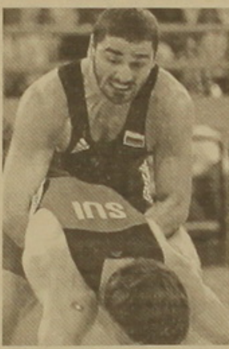
Բրոնզե մրցանակակիր Վարդերես Սամուրազեան:

ուրախություն չդասճանոցեցն մարզիկներին ու նրանց երկրպագուներին: Եվ դա հասկանալի է, քանի որ օլիմպիական կրկնակի չեմպիոն Արման Լազարյանից (60 կգ, Բուլղարիա) եւ Սիդնեյի օլիմպիական չեմպիոն ռուսաստանցի Վարդերես Սամուրազեանից (74 կգ) սրբախոսները մեծ էին: Տավոտ, երկուսն էլ անհաջող հանդես եկան կիսաեզրափակիչում եւ ստիպված էին մայրաքաղաք բրոնզե մեդալների համար: Դեռ լավ է, որ նրանք հաղթանակով ավարտեցին իրենց գոսեմարտերն ու բարձրացան մասվոր մասվորակների 3-րդ աստիճանին: 60 կգ քաշային կարգում Արման Լազարյանը բրոնզե մեդալի համար մրցավեճը շահեց ռուսաստանցի Ալեքսեյ Շեյնովիցի (4-3): Զաւային այս կարգում չեմպիոնի կոչման համար գոսեմարտեցին կորեացի Ջի Հյուն Ջունգը եւ կուբացի Ռոբերտ Սոնգոնը: Կորեացի ըմբիշը, որը կիսաեզրափակիչում հաղթել էր Արման Լազարյանին, վճռորոշ գոսեմարտն էլ վստահ անցկացրեց (3-0)