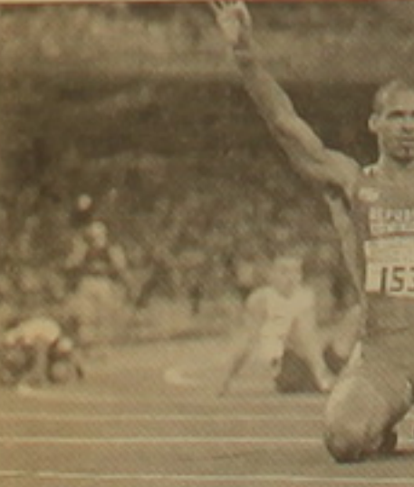
Ֆելիս Սանչեսը տոնում է հաղթանակը:

սը, իսկ բրոնզե մրցանակակիր Ջաստին Գետլինը ցույց սվեց 20,03 վրկ արդյունք: Նամիբիացի հանրահայտ արագավազոր Ֆրենկի Ֆրեդերիկսը մնաց առանց օլիմպիական մեդալի՝ գրավելով 4-րդ տեղը: Տղամարդկանց 400 մ արգելավազում ուժեղագույնը Դոմինիկյան Հանրապետության ներկայացուցիչ Ֆելիս Սանչեսն էր (47,63 վրկ): Համահայտ այս մարզիկը վերջին տարիներին հաղթող է ճանաչվել բոլոր այն մրցումներում, որոնց մասնակցել է: