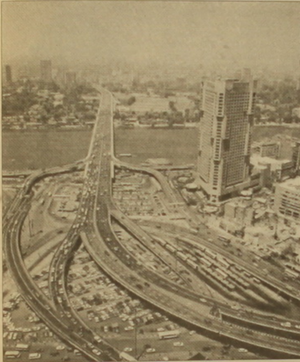
Նոսահարկ ռոտորասների գտնջ Կահիրեում

Այսօր Եգիպտոսի Արաբական Հանրապետությունը տննում է իր ազգային տննը: Հիսուներկու տարի առաջ՝ 1952 թ. հուլիսի 23-ին, Եգիպտոսի զինված ուժերի զանգեռով են արաբական ազխարհի անվեհեր զավակ զամալ Արդել Նասերի առաջնորդությամբ վերջ տվեց բրիտանական երկարամյա գաղութարարությանը, սաղալվեց Ֆարուք թագավորի հետամնաց իշխանությունը, եւ նոր էջ բացվեց ինչպես Եգիպտոսի, այնպես էլ արաբաբերջանային յասնության մեջ: