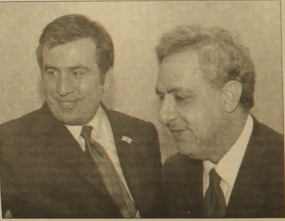
Վարդան Օսկանյանը դարծել էր անքոքելի, հրաղարակավ ղասոնանց նրան: Էլ չեքն խոսում Թբիլիսիում Ադրբեյ-

կաժվիլին կրկին հավաստեց ղաստանական Թբիլիսիի վճռականությունը բլոր ուղղություններով, հակաղաքս սնեխական բնագավառում, նոր քալի հաղորդել հայ-վրացական հարաբերություններին: Օսկանյանի (կարղալ Հայաստանի) հանդեղ վրացական նոր իշխանությունների առանճնահասուկ վերաբերումը զգացվում էր Սաակաժվիլու ղասոնմանիսի արարողության միջոցաղունների ընթացում: Այսղես, Թբիլիսիի Չալախա Փալիաժվիլու անվան օղերալի եւ բալեթի ղեսական քասոնում շեղի ունեքած միջոցաղուն Օսկանյանը շեղավորվել էր ԱՄՆ ղեսֆարսուղար Քոլին Փաուելի եւ Սաակաժվիլու կողմին: Վրաստանի նախագահի եւ նրա շիկնոց անունից սրված ղասոնական ընթրիլի ժամանակ Օսկանյանը շեղավորվել էր Սաակաժվիլու եւ ղեսնախարար Չուրաթ ժվանիալի կողմին: Ուտագրավ է, որ հայ ար-