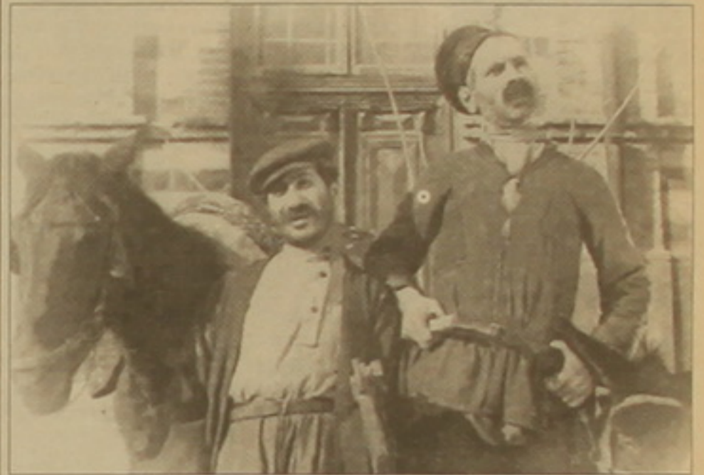
«Շոր և Շորշոր»