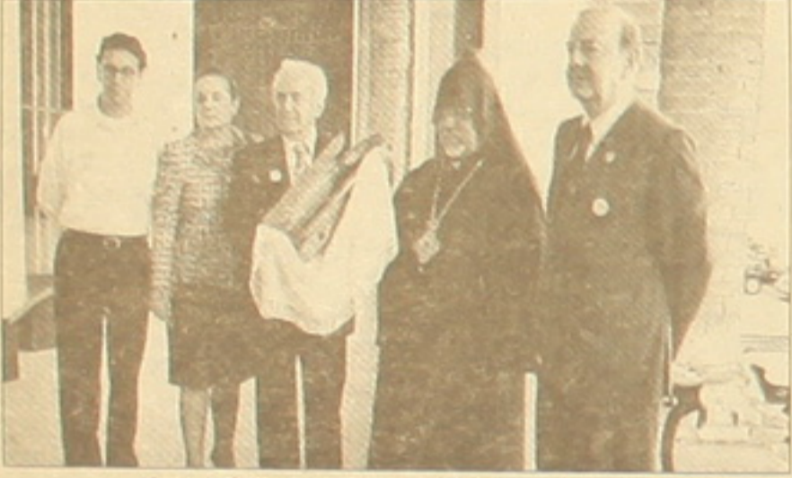
Մամ Դատույրյունի մոտև Մամ Դատույրյունի Դատույրյունի մայր Էլեն Դատույրյունը, Գեորգի Կարմուան Բուրմայանը, Տաթև Կարմուան Բուրմայանը, Դատույրյունի Մամ Դատույրյունը, Գեորգի Կարմուան Բուրմայանը, Մարտին Առաձուձ:

Երբ ես գտնվում էի Բրազիլիայում, իր սեղանին լուսավորված նկարներ