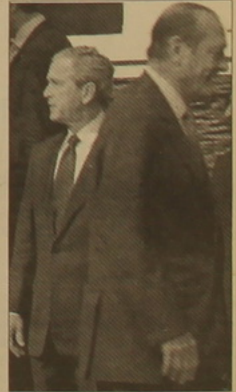
ՌԱՍՏՈՎՈՒՄ, Ալղանստանում սեղաբախի արագ ծավալման ուժեր: Իր առաջարկություններով նա կոնկրետ քվադրակուսյունից զրկում է ամերիկյան «Մեծ Մեծավոր Արեւել» ծրագիրը:

բայց ի հեռու Բուլճի ընդգծում է, որ անդամակցության բանակցությունները կլինեն «երկարատև և դժվարի»: Շիրակը փաստորեն հակադրվում է սեփական կուսակցությանը, որը Եվրոխորհրդարանի վերջին ընտրությունների ժամանակ հակաթուրքական արածվել էր Եվրամիությանը, Եվրոպայի կառավարությանը, Եվրոպայի կառավարությանը, Եվրոպայի կառավարությանը, Եվրոպայի կառավարությանը: Եթե Թուրքիայի հարցում ֆրանսիական սարաձայնությունները փոքր-ինչ արեւսական են թվում, նույնը չի կարելի ասել ՆԱՏՕ-ի զագաթաժողովի մյուս թեմաների մասին: Ասամբուլում Շիրակը հանդես է գալիս որդե «հին Եվրոպայի» խոսքով՝ ընդդեմ ԱՄՆ-ի, Մեծ Բրիտանիայի և նրանց դասակարգների: Շիրակը մասնավորապես դեմ է, որ ՆԱՏՕ-ն Իրաքում զբաղվի իրազեկի զինվորականների դաստիարակմանը, Ալղանստանում սեղաբախի արագ ծավալման ուժեր: Իր առաջարկություններով նա կոնկրետ քվադրակուսյունից զրկում է ամերիկյան «Մեծ Մեծավոր Արեւել» ծրագիրը: