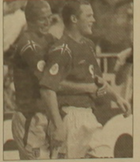
Ռունիի մասին իր դրական կար- ծիքն է հայտնել նաեւ ֆուտբոլի արհ- արքը: «Ռունին արդարապես ֆու- տբոլիստ է: Նա իր արդի համեմատ բավական հասուն ու վարձեց խաղ էր ցուցադրում: Համոզված ենք, որ նրան մեծ արդար է ստատում»:

Ֆուտբոլի Եվրոպայի առաջնու- թյանում իր գերազանց խաղով մաս- նագրեցին ուղեգրության կենտրո- նում է հայտնվել Անգլիայի հավա- քականի 18-ամյա հարձակվող Ուեյն Ռունին, որը հանդես է գալիս անգ- լիական «Էվերթոնում»: Ավուսթի գործարքի սնունդ էր Բիլ Զեյտարը հայտարարել է, որ դասն է հարձակ- վողի գինը զգալիորեն աճել է: Ռու- նիի համար հարկ կլինի վճարել 50 մլն ֆունտ ստեռլինգ: Իսկ մինչ այդ Եվրոպայի դարձաբախմա 2 գոլ խիս- տ հետ Ռունիի ցուցանիշների արժեքը 45 մլն ֆունտ ստեռլինգ էր: Բնականաբար, եթե Անգլիայի հա- վաքականը Եվրոպայի առաջնու- թյանում, իսկ Ռունին էլ աչի ընդհին արդյունավետությամբ, առաջ նրա գինն էլ ավելի կբարձրանա: Թեեւ դրան, «Էվերթոն» ղեկավարությու- նը բնավ էլ չի դաստիարակում հրա- ժարել իր հարձակվողի ծառայու- թյուններից: