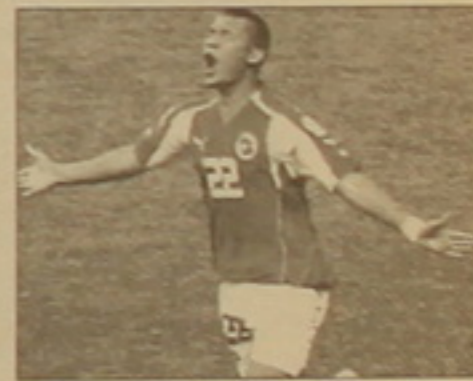
Տարաբել է, որ, իհարկե, ուրախ է ռե- կորդի համար, սակայն երբ իր խիստ զուլին մրցակիցը դարձաբախմա է երեւել, ռեկորդը չի կարող ճանաչ- ությունը բարձրացնել:

Վելյարացի հարձակվող Յոհան Ֆոնլանսենը դարձավ Եվրոպայի ա- ռաջնությունների ամենաերիտա- սարդ ֆուտբոլիստը, որին հաջողվել է դառնալ գոլի հեղինակ: Ֆրանսիայի հավաքականի հետ խաղում Ֆոնլան- սենը 27-րդ րոտից գրավեց Ֆարսեն Բարսեգի դարձաբախմա: Այդ օրը Ֆոն- լանսենը 18 օրական 141 օրական էր: Ֆոնլանսենը գերազանցեց ըն- թացիկ առաջնության լավագույն նմբարկու Ուեյն Ռունիի ռեկորդային ցուցանիշը: Նա Վելյարացիի հա- վաքականի դարձաբախմա գրավել էր 18 օրական 7 ամսական 24 օրակա- նում: Ռեկորդակիրը խաղից հետո հայ-