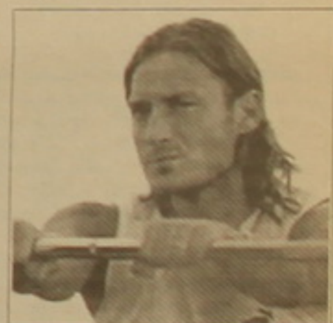
Կարծիքով, այդ որակազրկումը չի ազդի իսայացիների մարտունակության վրա: «Ով էլ որ փոխարին Տոսիին, անկասկած, վարդետ խաղացող կլինի: Մեւն ղետ է կենսունանան մեր խաղի վրա: Պարասսվում ենք այն բանին, որ Տոսիի փոխարեն կիսաղա Կասանոն:

ՈՒԵՖԱ-ի կարգաղահական կոմիտեւն կիսաբոսի «Մերիդին» հյուսուցուում կայացած նիստում կնարկել է Իսայիայի հավախականի հարձակվող Ֆրանչեսկո Տոսիի անվայելուչ վարագիծը, որը Դանիայի ընտրանու հետ խաղում թել էր Ջիսիան Պոուսենի դեմին: Խաղային այդ դրվազը ցուցադրվել էր դանիական հեռուստընկերությամբ, ինչն էլ դանիացիների բողոքի հիմ էր հանդիսացել: Տոսիին կարգաղահական կոմիտեւն որակազրկել է 3 խաղով: Դա նեւանկում է, որ նա կարող է խաղաղաշ դուս գալ միայն կիսաեզրակիչում, եթե, իհարկե, իսայացիները հասնեն մինչեւ այդ փուլ: