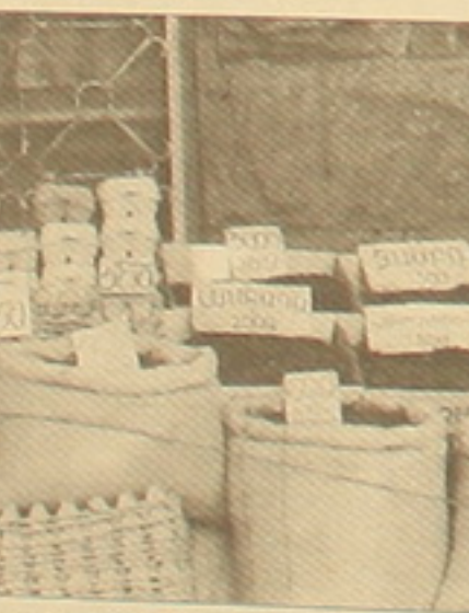
Սուրճի առաջատար հայրենական արտադրության ցանցի մի մասն է «Փիար» կազմակերպությունը:

Հայաստանում այսօր արդեն 3400 հասարակական կազմակերպություններ կան, թեւէ կազմակերպական հասարակություն ասվածը մեզանում նույնիսկ առըմային չի ձեւակում չէ: Նույն խնդիրն է կողմից միջոց դիրմուռում մեկտեղ սկսել հարցի առթիվ, որոնք կարևոր է որ առաջատար երկրների կողմից միջոց դիրմուռում մեկտեղ սկսել հարցի առթիվ: