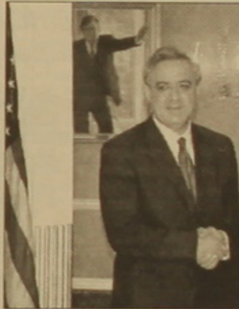
Վարդան Օսկանյանը Զոլին Փաուելի հետ:

ԵՐԵՎԱՆ, 15 ՅՈՒՆԻՍ, ԱՐՄԵՆԿՈՐԵՍ: Երկու ամիս առաջ Վարդանյանի այցով ԱՄՆ-ում գտնվող ԳԳ ԱԳ նախարար Վ. Օսկանյանը հունիսի 14-ին հանդիպել է ԱՄՆ ղեկավարող Զոլին Փաուելի հետ: Կայանալիք ՆԱՏՕ-ի զագաթաժողովին եւ Լեռնային Ղարաբաղի հակամարտության կարգավորմանն առնչվող հարցեր: Այցի ընթացքում նախարար Օսկանյանը հանդիպումներ է ունեցել