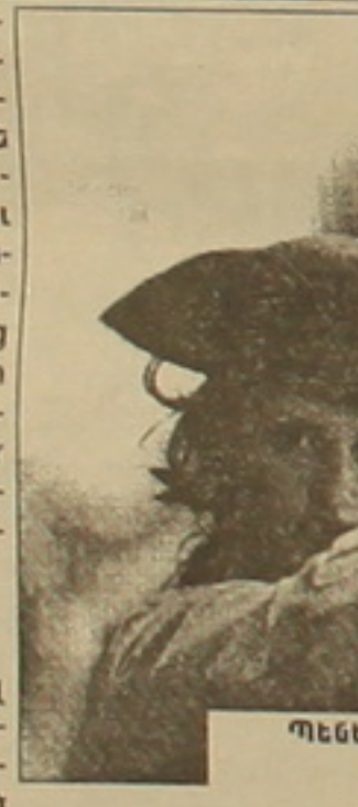
Պենելոպե Կրուը «Ֆանֆան վարդակալայ» ֆիլմում

Խորիս Լուիս Բորիսեսի մեծաֆիզիկայի կրանային ժառանգորդը դարձած Ռաուլ Ռուիսը արգենտինացի մեծ գրողի ազդեցության տակ ընկավ, երբ 60-ականներին Արգենտինայում ասավածաբանություն, իրավունք եւ սոցիոլոգիա էր ուսանում: Բորիսեսի կենսագիրը Ալի-