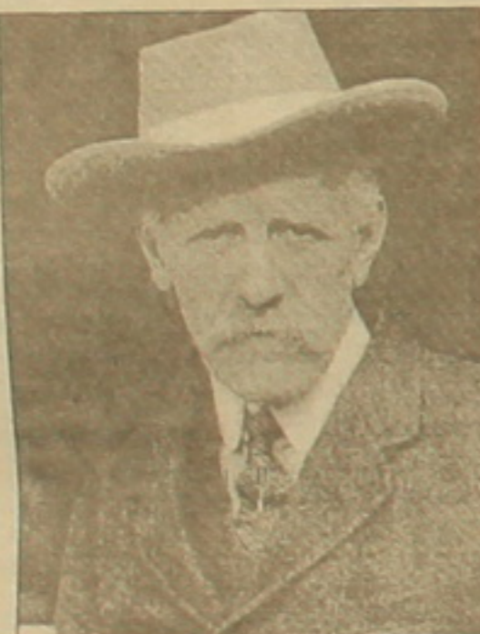
Ֆրիսյոֆ Լանսենի վերադարձն արդեն իսկ իրողություն է: Այնուամենայնիվ, այստեղ տեղին է վերիիցել ասվածաճնչյան մարգարի տողերը, որ աղեցուցիչ ձեռով վերաբերում են նաեւ Ֆրիսյոֆ Լանսենին: «Իմաստուն մարդիկ ողիս ճառագեն իբրեւ երկնակամարի լուսատուներ, իսկ արդարներից Եասերը, առավել եւս՝ իբրեւ հավիտենական սուղեր»:

Իր արդարությամբ սրբազորված Ֆրիսյոֆ Լանսենն իր հեծ ասողային հավիտենություն սարավ մարդու ցավը, ֆանի որ այսօր էլ մոլորակը երբեմն-երբեմն տնում է այդ ցավից: Արդարության իր ասողից ճառագող լույսերի մեջ կենդանացնելու սարավ հայոց մուխը մարած սների, վիզը ծուռ ոտրուկների հիգասակը եւ մնաց իբրեւ մարդկային արժանապատվության համար մոլորակի վրա բարձրացված դրոշին վեծվեցող արեւի ճառագայթը: