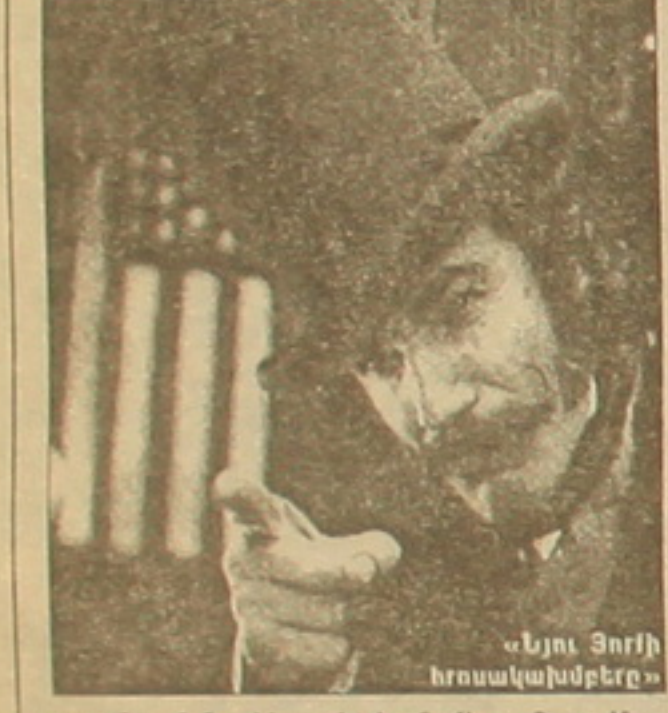
«Նյու Յորքի հրատարակիչները»

Անցյալում Պլինիոսը փակուղու մեջ էր, որ մտադիր էր բողոքել կինոյն: Հասցրեց համարում էին, թե