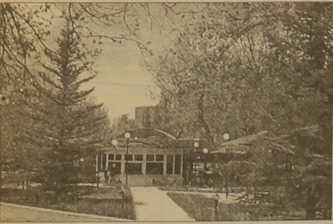
«Ջրահար» արձաքափայլ «միզազված» եղեւնիները: