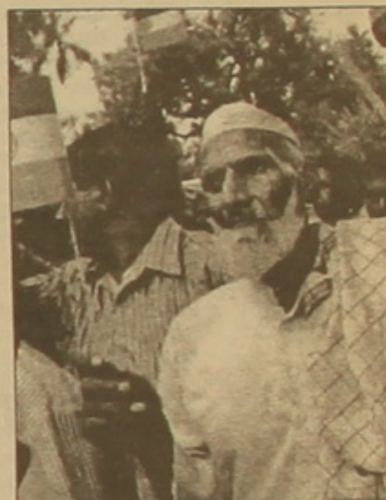
Տորքմենստանի Վաշդայի կիստրի վերահսկման գծի երկայնքով, որդեսգի զինյալ արմատականները լրափակեցին Շնդկաստան: Դրանով Իսլամաբադը փաստորեն խոստովանել էր սահմանախախտումների գոյությունը:

Իրականում հեռախոսազանգն այնքան էլ անստանալի չդեռ է համարել, քանի որ ապրիլի 18-ին հնդկական Քաշմիրի կենտրոնում Մի-նազար կասարած այցելության ժամանակ Վաջդային «բարեկամության ձեռք էր մեկնել» Պակիստանի երկխոսությունը կոչ արել: Դա իրոք անստանալի էր հնդկա-թուրքմենստանյան լարված հարաբերությունների դրամատիզմը: 1947 թ. Պակիստանի ստեղծումից ի վեր Քաշմիրը իսկական կռիվների դարձել է Դելիի և Պակիստանի միջև: 1989 թ.-ից Շնդկաստանը Պակիստանին մեղադրում է այնտեղ աղյուսակային իսլամիստ արմատականների աջակցելու մեջ, որոնք բազմիցս ներխուժել են Շնդկաստանի տարածք: