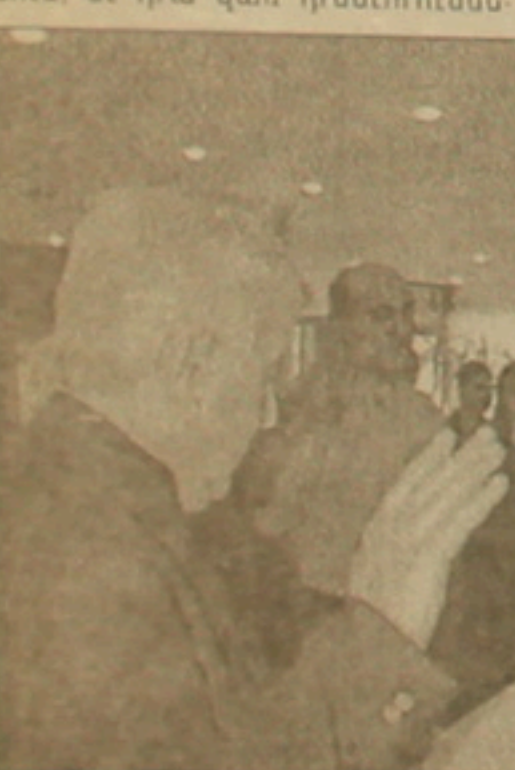
Իրից մեկը, թեքես, սվյալ կուսակցության անդամագրվելն է:

Յուրաքանչյուր ֆադաֆական ուժի համար երկրի ֆադաֆակների աջակցությունն ու վստահությունն առավել զննահանել են մասնավոր նախընտրական օրհանգիցում, եւ դրա վրա դրսևորում են: