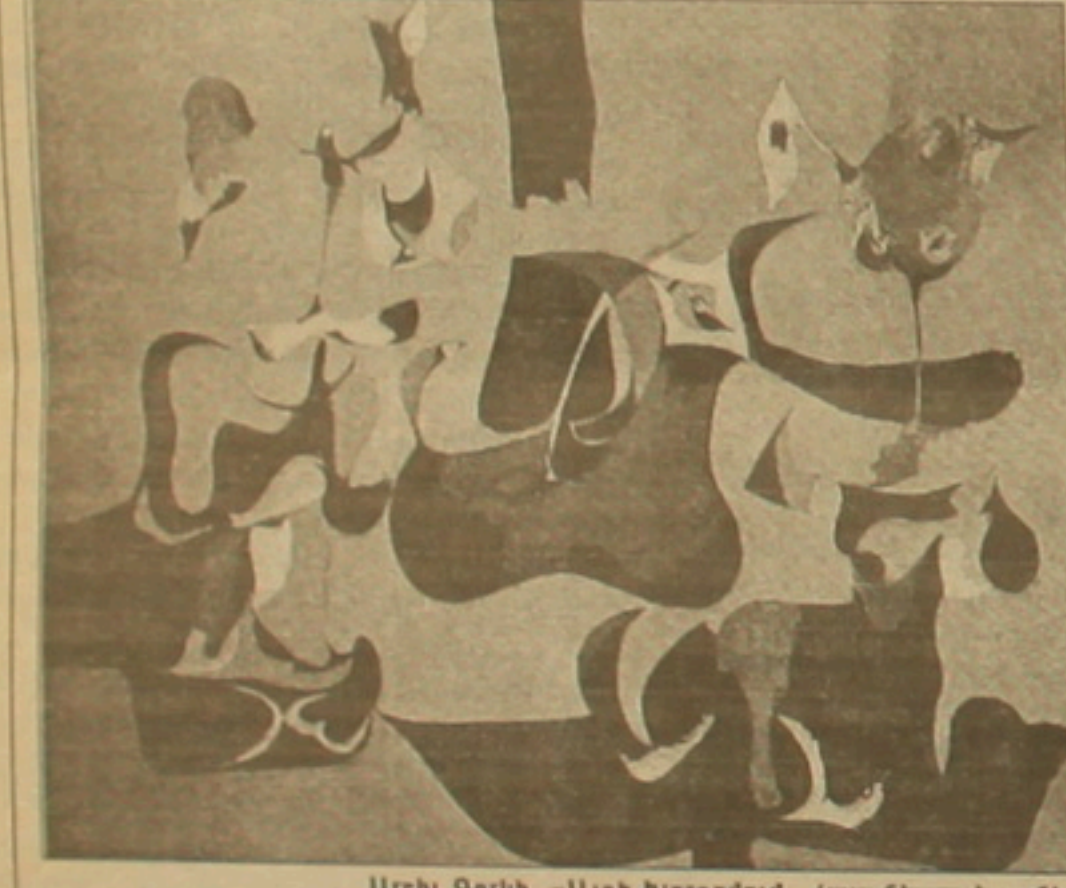
Արշիլ Գորկի. «Այգի խորհրդում» (այս նկարը հայտնի է «Այգի Սոյիում» անվանումով):

20-րդ դարի ոչ մի հայ տեղեկագրորդ այժման ճանաչված ու գնահատված չէ միջազգային արվեստագիտական ցրանակներում, որում Արշիլ Գորկին (Ռուսոմիկ Աղոյանը): Որքեր Ելուրսմ առում է. «Անասարկելործն Նյու Յորքում երբեկից տեղեկագրործած ամենից տաղանդավոր արվեստագէտներից մեկն է»: Արվեստարան Անդրե Բրեռնը նրան համարում է Միացյալ Նահանգների դասնորքայն մեջ երբեկից եղած նկարիչներից մեծագույնն ու յուրահատուկը: Իսկ գեղանկարչության համաշխարհային գիտակներից մեկը Ուիլյամ դը Էուսմիճը գրել է. «Ես հաստատ կարող եմ ասել, որ նրա շատ նկարներ վաղից մեծ են, քան Պիկասոյի, Մաթիսի եւ Էլ Գրեյոյի նկարները»: Սա մերոնց կարծիքը չէ, օտարազգի աշխարհաօրայակ արվեստարաններն են խոսում, եւ ազգային սնադարծության մասին խոսք լինել չի կարող: