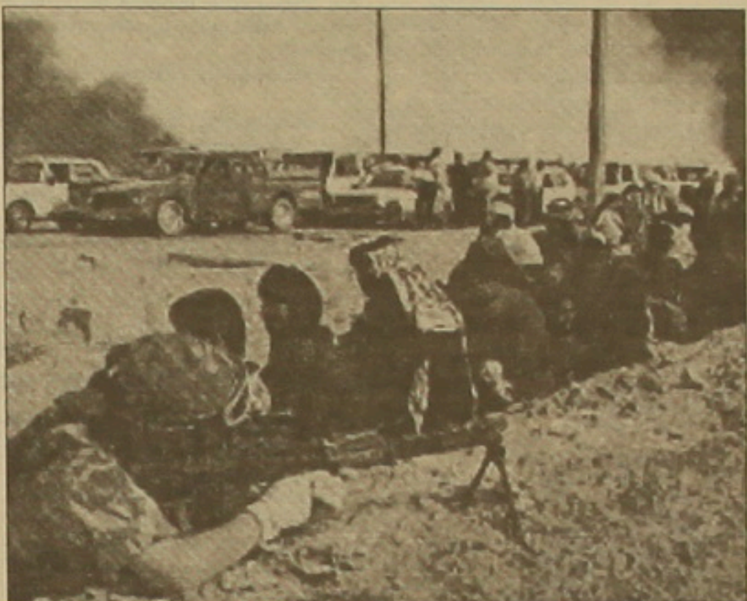
Երեկ ամբողջ գիշեր անգլո-ամերիկյան օդուժը ռմբակոծել ու հրթիռակոծել է Իրաֆի մայրաքաղաքը: Միայն Բաղդադի կենտրոնում զսնվող նախագահական դաշակի վրա 2 ռումբ է ընկել: Ֆրանսիացի զորավարությունը հաղորդում է, որ գիշերվա ժամը 2-ին Նաջաֆ ֆաղաֆի մոտակա խճուղու վրա ամերիկյան հրամանատարական անցակետում գնդակոծվել է իրաֆյան մարդասարսափ սպորուս, որը կանգ չէր առել անցակետի մոտ: Հաղորդվում է, որ առանց նախազգուշացման կրակոց արձակելու ամերիկացի զինվորները գնդացիներից կրակ են տեղացել ավսորուսի վրա: Մղանվել են 10 խաղաղ բնակիչներ, այդ թվում 5 երեխա: Վերավորվել են 2 անձինք:

Ամերիկյան Fox News հեռուստաընկերության թղթակից Ջեյմս Բրայդը Ռիվերսի Իրաֆից արտաքին վերաբերյալ արգելված տեղեկություններ հաղորդելու ամբաստանությամբ: Վաղ առավոտյան Իրաֆի հեռուստատեսությամբ ելույթ է ունեցել բանակի հրամանատարության ներկայացուցիչը, ասելով, թե Նասիրիայում եւ դրա ծայրամասերում իրաֆիները կասադի մարտեր են մղում անգլո-ամերիկյան ուժերի դեմ, որոնք զգալի կորուստներ են կրում: Անկախ աղբյուրների սվյալների համաձայն, հակաիրաֆյան կռիվներից հետո կորուստներ կազմում են 200 սղանված: Բուժման նղաճակով Իրաֆից դուրս