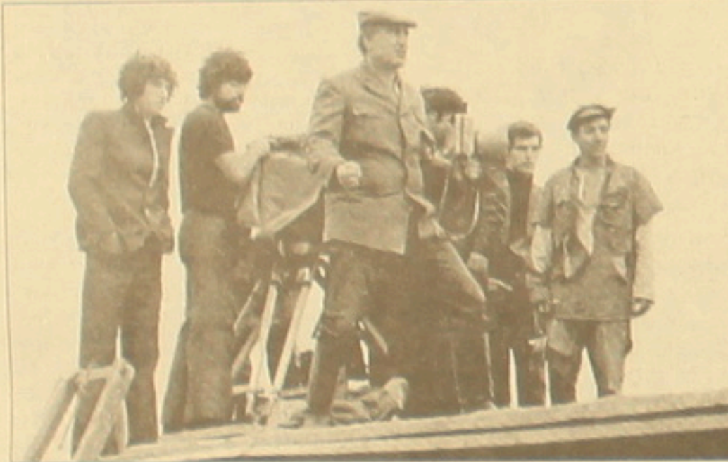
Ֆրունզե Դովլաբյանը իր ֆիլմերում օգտագործել է իր սեփական փորձը և արժանապատիվությունը:

Այսօր դժվար է դասկերպել հայ կինոն առանց Ֆրունզե Դովլաբյանի, առանց «Բարե ես եմ»-ի, առանց «Մենավոր ընկուզեմու», առանց «Արեգեմ երկար»-ի, առանց «Երեւանյան օրերի խոնդիկ»-ի, առանց «Կարոտի», առավել եւս առանց «Մարտյան եղբայրներ»-ի: Ինչ թեմայով է նկարել է, միեւնույն է կարողացել է այնտիպ գործը ստեղծել, որով դասակարգված երկրի կինոմասնագրաֆիկ: Սա յափազանցություն չէ. աշխարհի կինոյի հզորների կարծիքն ենք միայն արձանագրում: